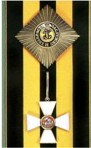
Το παράσημο Αγ. Γεωργίου 1 ης Τάξεως

Το παράσημο του Τάγματος αυτού έχει απονεμηθεί σε πάνω από 10 χιλιάδες αξιωματικούς που πολέμησαν κάτω από τη ρωσική σημαία. Η υψηλότερη 1 η Τάξη απονεμήθηκε συνολικά σε 25 αξιωματικούς (π.χ. σε Αυτοκράτορες, πρίγκιπες, στρατηγούς, ναυάρχους κ.ά.), από τους οποίους μόνον 4 κατείχαν και τις 4 Τάξεις του Παρασήμου. Η 2 η Τάξη έχει απονεμηθεί σε 125 αξιωματικούς 5 .