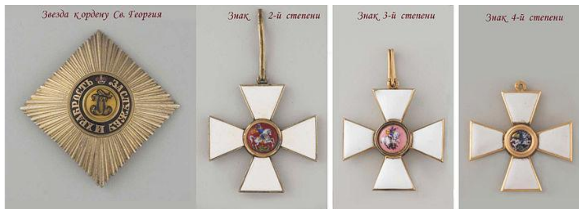
Πίνακας με τα σημερινά μετάλλια των 4 Τάξεων του Τάγματος του Αγίου Γεωργίου.

Το παράσημο του Τάγματος αυτού έχει απονεμηθεί σε πάνω από 10 χιλιάδες αξιωματικούς που πολέμησαν κάτω από τη ρωσική σημαία. Η υψηλότερη 1 η Τάξη απονεμήθηκε συνολικά σε 25 αξιωματικούς (π.χ. σε Αυτοκράτορες, πρίγκιπες, στρατηγούς, ναυάρχους κ.ά.), από τους οποίους μόνον 4 κατείχαν και τις 4 Τάξεις του Παρασήμου. Η 2 η Τάξη έχει απονεμηθεί σε 125 αξιωματικούς 5 .