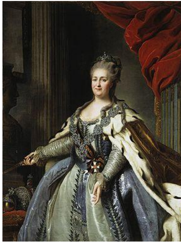
Η Αικατερίνη Β' με το Τάγμα του Αγίου Γεωργίου, 1 ης Τάξεως, F. Rokotov 1770