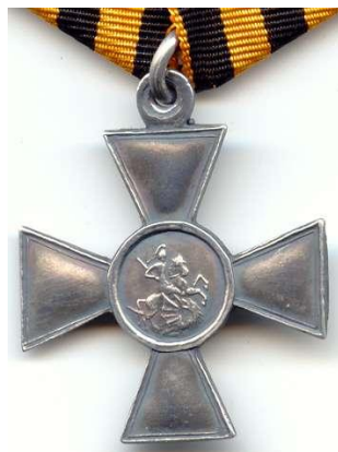
Εικόνα γνήσιου παρασήμου του Τάγματος του Αγ. Γεωργίου 4 ης Τάξεως, όπως ήταν κατά την περίοδο απονομής

Στον Κατάλογο δίδεται κατά σειρά το επίθετο, το όνομα και το πατρώνυμο, ο βαθμός κατά τον χρόνο της απονομής. Επίσης δίδεται ο αριθμός του καταλόγου κατάταξης κατά Grigorovits-Stapanov 12 . Οι αριθμοί στις παρενθέσεις προέρχονται από τον κατάλογο κατάταξης κατά Sudravnkov 13 . Έπεται η ημερομηνία απονομής.