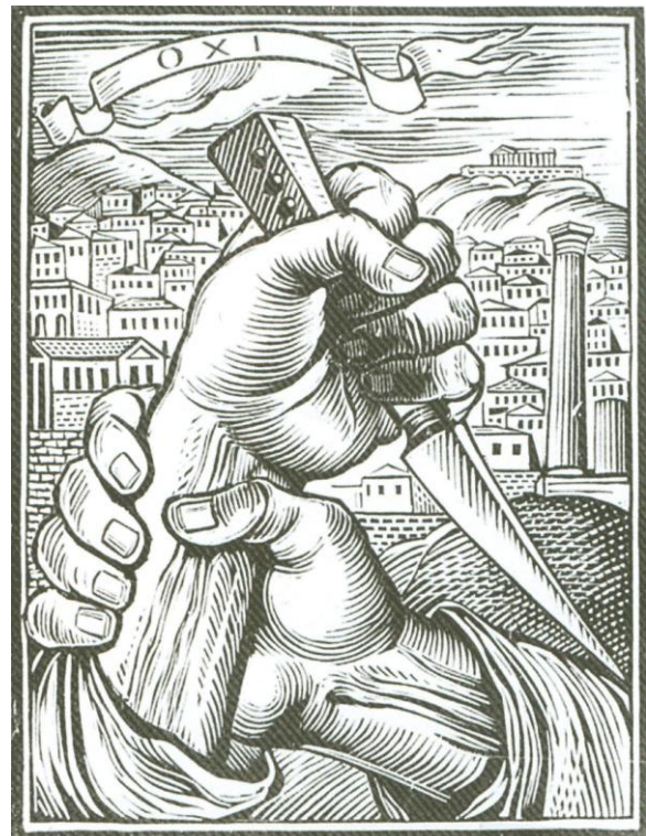
Το στιλέτο. Ξυλογραφία Α. Τάσσιου

Όπως όμως όλες οι μεγάλες ιστορικές ενέργειες είχε και ο δοξασμένος τούτος αγώνας του Ναυτικού μας, εκτός από τα φώτα, και τις σκιές του. Στις δεύτερες συγκαταλέγεται το αντεθνικό κίνημα της Μέσης Ανατολής - όπως αναφέρει ο ναύαρχος Φωκάς - τον Απρίλιο του 1944, το οποίο κατεστάλη από τα αγήματα εμβολής, δυστυχώς με θύματα.