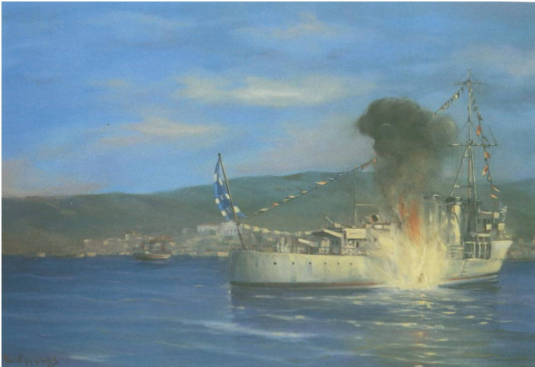
Ο торπιλισμός της Έλλησ από το ιταλικό υποβρύχιο «Delfino» Η Κυβέρνηση Μεταξά δεν ανακοίνωσε, αν και ήξερε, την εθνικότητα του υποβρυχίου

Τρεις είναι οι μεγαλύτερες, καθολικού χαρακτήρα, εξάρσεις του νεοελληνικού έθνους. Το 1821, το 1912 και το 1940. Η πρώτη, παρά τα ενάντια πολιτικοστρατιωτικά δεδομένα, δημιούργησε τις προϋποθέσεις εκείνες που έπεισαν τη Διεθνή Κοινότητα ότι έπρεπε να δημιουργηθεί ένα νέο ελληνικό κράτος στην εσχατιά της Βαλκανικής. Η δεύτερη, με την Ελλάδα ισχυρότερη και καλύτερα προετοιμασμένη, οδήγησε στην απελευθέρωση της αλύτρωτης Μακεδονίας, Ηπείρου και των νήσων του Βορείου Αιγαίου. Τέλος η τρίτη, αντιμετώπισε και απώθησε τον εισβολέα κάνοντας πράξη το «ΟΧΙ» που από το 1939 είχε αποφασίσει, ήδη, μέσα του ο αντισυμβατικός, απόμακρος, ρεαλιστής Μεταξάς.