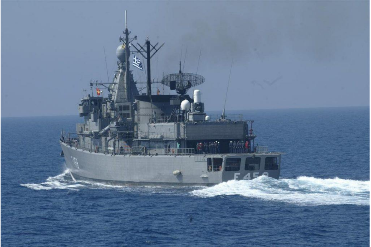
Η σκυτάλη: Η φρεγάτα του Πολεμικού Ναυτικού Φ/Γ ΑΔΡΙΑΣ (F 459).