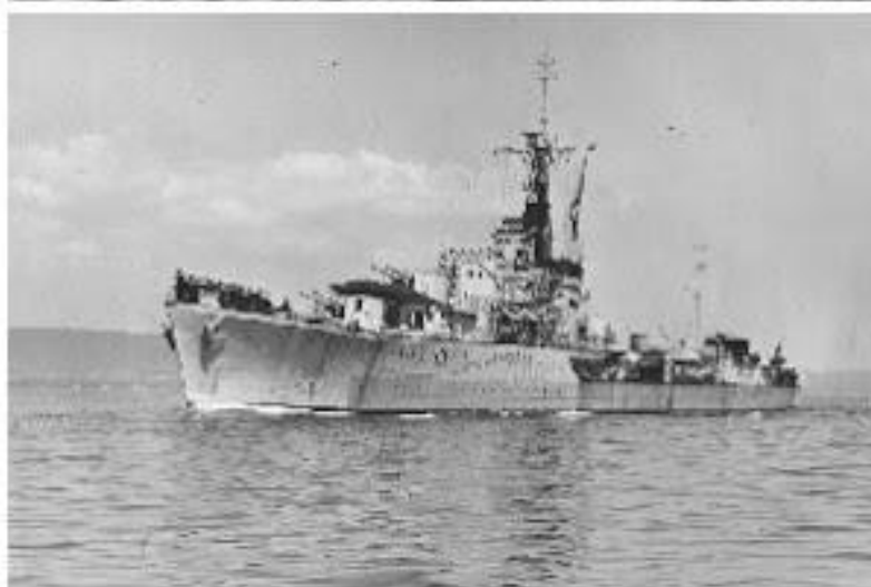
HMS Penn (άνω) και HMS Jervis (κάτω).

Τα δυο αντιτορπιλλικά, που συνόδευσαν τον ΑΔΡΙΑ κατά την πορεία του από το Καστελλόριζο προς τη Λεμεσό, παρέχοντας την προστασία τους.