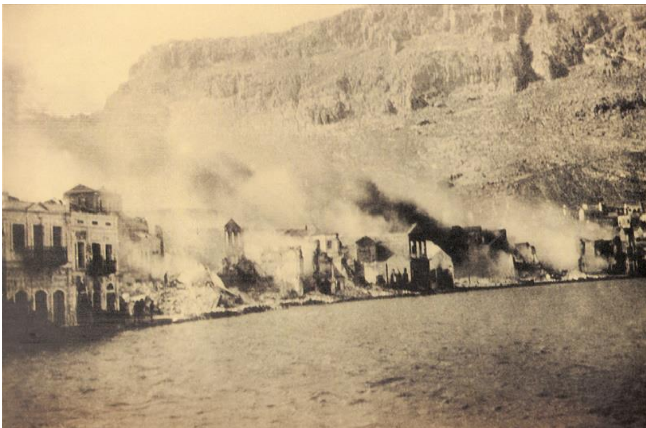
Το Καστελλόριζο την επομένη του βομβαρδισμού.