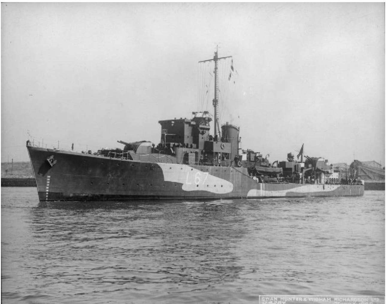
Το Α/Τ ΑΔΡΙΑΣ στην αρτιμελή του μορφή.

Αφού στο πλοίο μας δεν υπήρχαν ναυτιλιακά βοηθήματα και θα έπρεπε να πλεύσωμε με μεγάλην ακρίβειαν σε υπερβολικά μικρήν απόστασιν από τις ακτές, ήταν οπωσδήποτε αναγκαίον κάποιος να μας πλοηγήση. Προς τούτο θα έπρεπε να διατεθή ακτοφυλακίς που να προπορεύεται και για μίαν στοιχειώδη προστασίαν, θα εχρειάζοντο μία ή δύο ακόμη ακτοφυλακίδες.