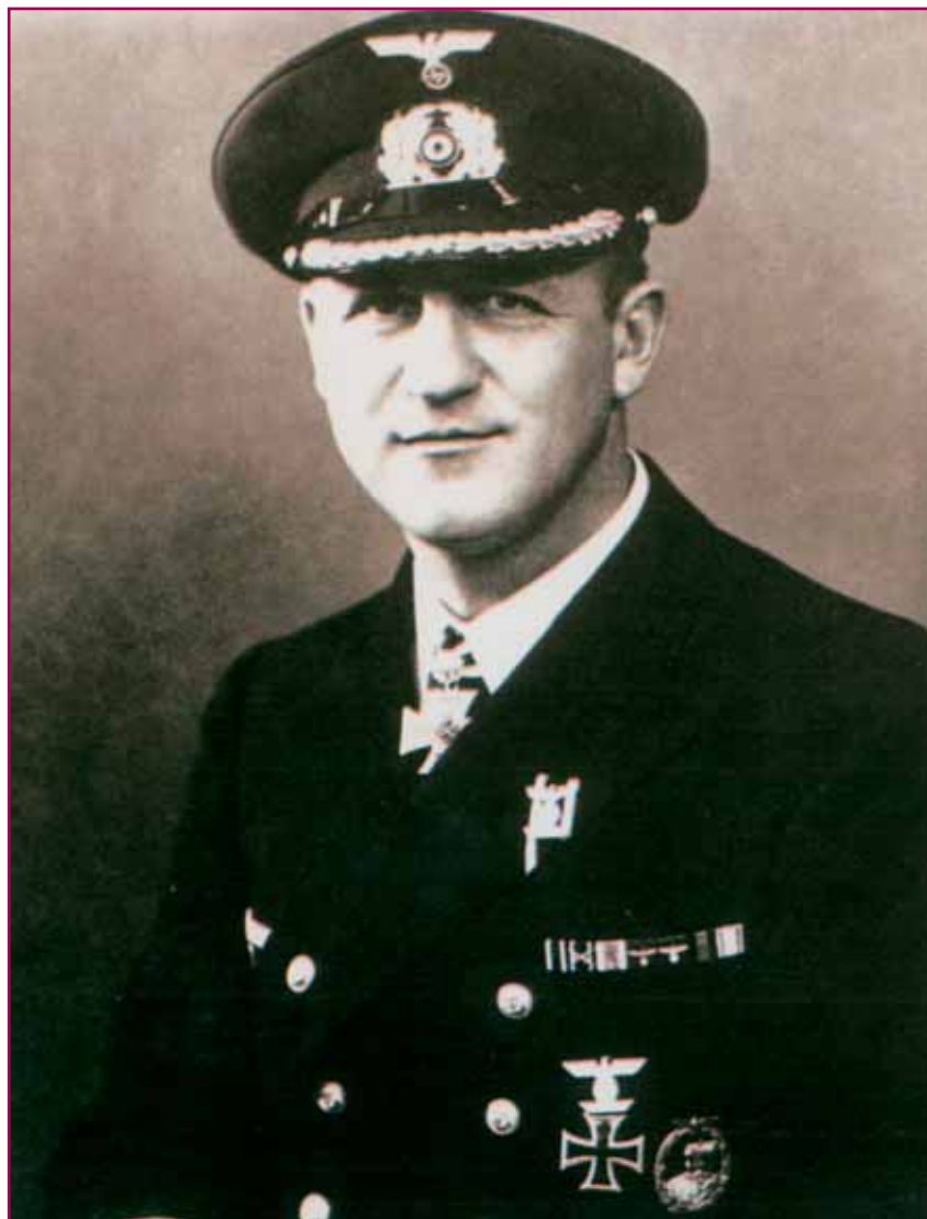
Ο πλοίαρχος Bernhard Rogge κυβερνήτης του «Atlantis».

Το άγημα λείας που επιβιβάζεται στο νορβηγικό αντικρίζει ένα φρικτό θέαμα. Το κατάστρωμα γεμάτο από φορτηγά, επιβατικά και νοσοκομειακά αυτοκίνητα μισοκατεστραμμένα με διαμελισμένα κορμιά και τραυματίες ανάμεσά τους. Υπάρχουν 5 νεκροί και άλλοι τραυματίες. Το πλήρωμα συγκεντρωμένο στο μέσο του καταστρώματος έχει άγριες διαθέσεις. Το πλοίο μεταφέρει πολεμικά εφόδια