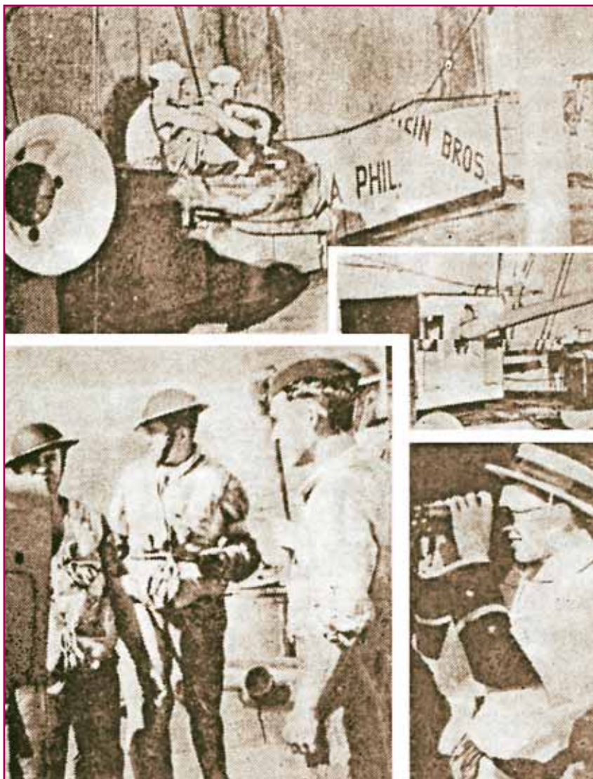
Τέσσερις εικόνες που δείχνουν πώς καμουφλαριζόταν το «Atlantis». Άνω: Τα πυροβόλα σκεπασμένα με μουσαμάδες. Μέσο δεξιά: Τα πυροβόλα ακάλυπτα. Κάτω αριστερά: Οι πυροβολητές με στολές Άγγλων. Κάτω δεξιά: Αξιωματικός του πλοίου με στολή τουρίστα.

ακόμα και τα αντιαεροπορικά. Μ' ένα χειρισμό, αντί να φεύγει το καμουφλάζ, ανέβαιναν τα πυροβόλα με την ομοχειρία τους έτοιμη για δράση.