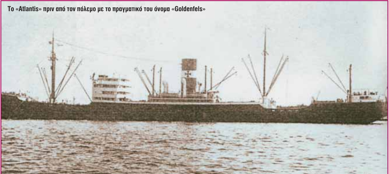
Το «Atlantis» πριν από τον πόλεμο με το πραγματικό του όνομα «Goldenfels»

Α ρκετά χρόνια μετά το τέλος του Β΄ Παγκοσμίου Πολέμου έγιναν γνωστά από τα επίσημα αρχεία των Συμμάχων και του Γερμανικού Ναυτικού Επιτελείου, τα έργα και αι ημέραι των γερμανικών επιδρομικών. Η δράση τους αποτελεί, ασφαλώς, μία από τις πλέον καταπληκτικές σελίδες του κατά θάλασσα πολέμου. Σελίδες γεμάτες περιπέτεια, τόλμη, πανουργία και ικανότητα των θαλασσόλυκων αυτών που διέσχιζαν τους ωκεανούς ψάχνοντας για τη λεία τους. Τα γερμανικά επιδρομικά αποτέλεσαν σοβαρότατο πρόβλημα για τις συμμαχικές θαλάσσιες οδούς. Τα κατορθώματα αυτών των «πειρατικών» δείχνουν την αποφασιστική σημασία των ναυτικών γνώσεων και του πνεύματος της πρωτοτυπίας των πληρωμάτων τους, αποδεικνύοντας τη σημασία των αρετών αυτών, όσο εξακολουθούν να υπάρχουν άνθρωποι και θάλασσα. Η δράση τους γέμει περιπετειών, τόλμης, αυτοθυσίας αλλά και ανθρωπισμού, στον αγώνα αυτόν της κατά θάλασσαν καταδρομής.