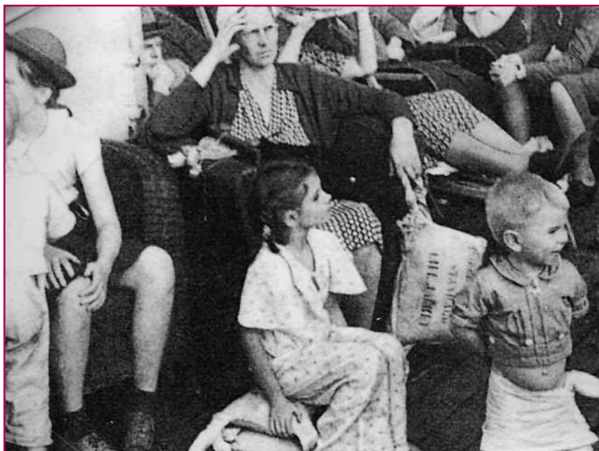
Ναυαγοί του «Zam-Zam»

Το «Atlantis» κατευθύνεται προς το σημείο «Λίλια-10». Δεν είχε περάσει