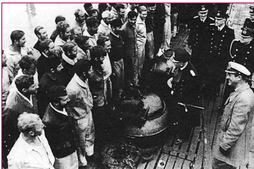
Διασωθέντες από τα «Atlantis» και «Pythou» στο κατάστρωμα του ιταλικού υποβρυχίου «Enrico Tazzoli» μετά την επιστροφή τους στο Σαιντ Ναζέρ (Γαλλία)

να πηδήσει στο υποβρύχιο το οποίο αμέσως μόλις απελευθερώθηκε από το επιδρομικό καταδύεται. Συγχρόνως το «Atlantis», στρέφοντας την πρύμη προς το καταδρομικό, αναπτύσσει όσο μεγαλύτερη ταχύτητα μπορεί για να απομακρυνθεί. Με κατεύθυνση προς τα νοτιοδυτικά ακολουθείται από τη βενζινακάτο του, την