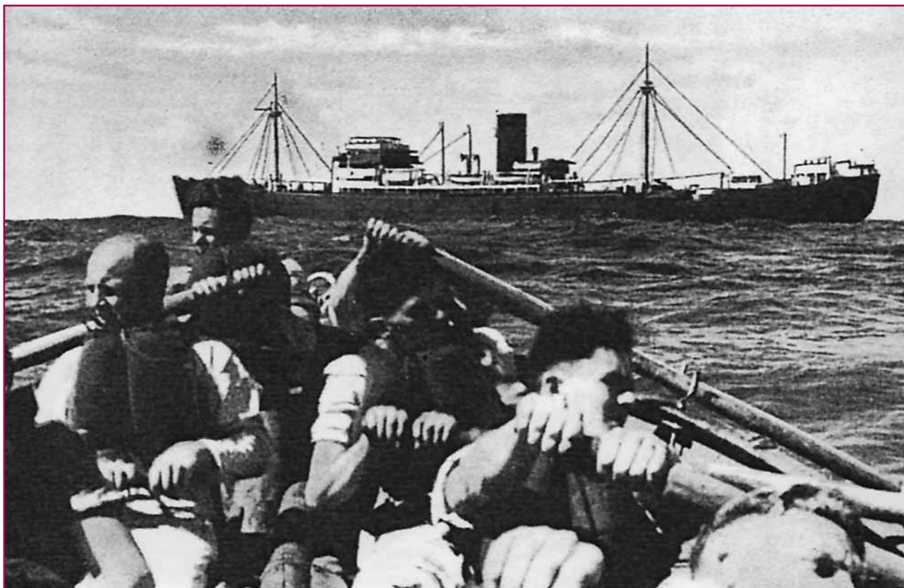
Αυτή είναι η μοιραία φωτογραφία του «Atlantis» που έβγαλε ο Αμερικανός φωτογράφος και το Βρετανικό Ναυαρχείο διένειμε σε πολλά αντίτυπα.