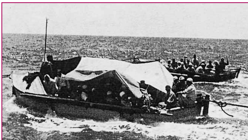
Τα σωσίβια μέσα που ρυμουλκεί το U-68 με ναυαγούς του «Atlantis» και του «Python»

λύει την πρώτη ομοβροντία που βρίσκει το στόχο. Το «Python» με τα μικρά του αντιαεροπορικά δεν μπορεί να προβάλλει καμία αντίσταση. Πέντε μόλις λεπτά αργότερα, στις 10.40 της 1ης Δεκεμβρίου 1941 βυθίζεται, την ίδια, περίπου, ώρα που πριν από εννέα μέρες είχε βυθιστεί το «Atlantis».