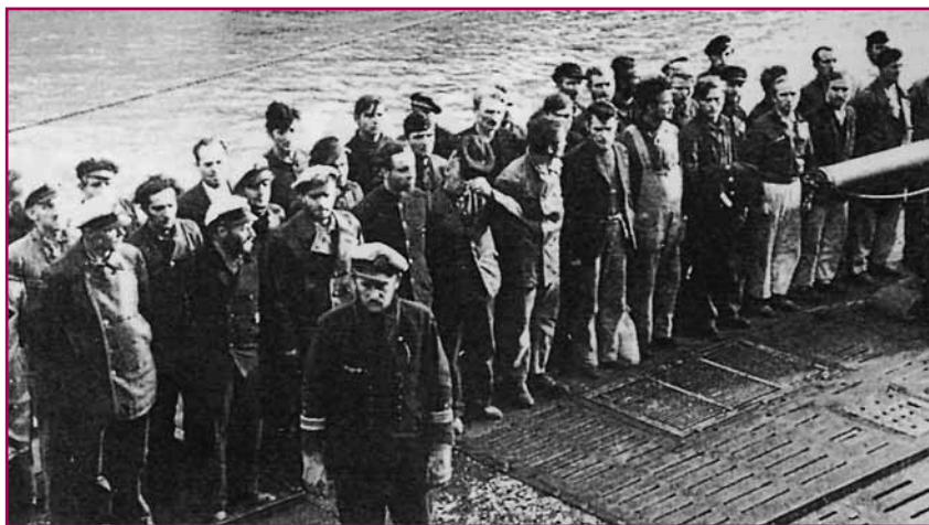
Μετά τη διάσωσή τους το πλήρωμα του ανεφοδιαστικού «Python» στο κατάστρωμα του U-129 κατά την άφιξή τους στη Γαλλία (Δεκέμβριος 1941)

Μία ομοβροντία των 8 ιντσών πέφτει στα απόνερά του για να δείξει την αποφασιστικότητα των Βρετα-