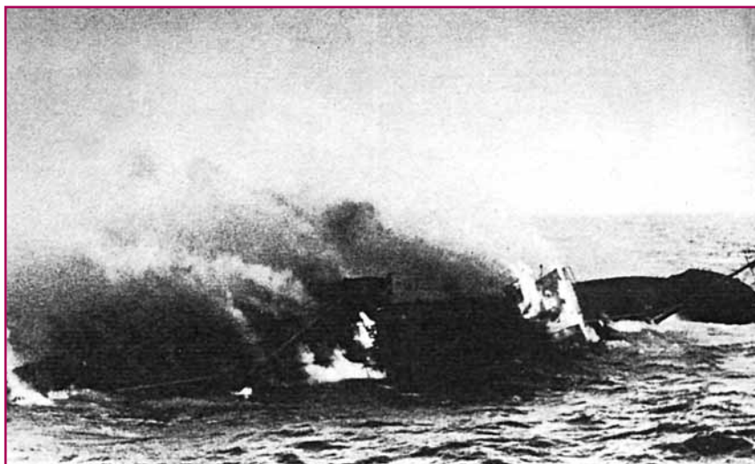
Η βύθιση από το «Atlantis» του «King City»

Το καταδρομικό πλησιάζει με ταχύτητα 25 κόμβων και στις 10.35 εξαπο-