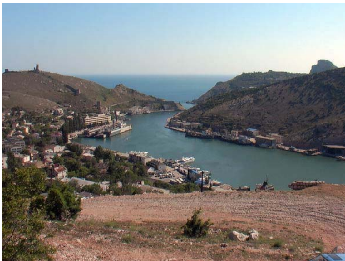
Η Μπαλακλάβα σήμερα.

Μπαλακλάβα, σιωπηλές κοπέλες σκλάβες. Ο Συβοροβ (Σουβούροφ), που διοικούσε στην Κριμαία, ήθελε να διαιωνίσει το γένος των Ελλήνων, να μην αποσωθούν, γι αυτό δεν τους εμπόδιζε. Υπάρχει κι ένα έγγραφο του 1778, που το αποδεικνύει.