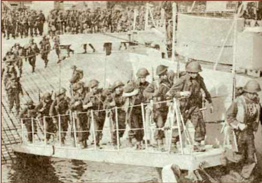
Καναδοί στρατιώτες στα καράβια για τη μεγάλη περιπέτεια

του Αντιναύαρχου (εα) Ξενοφώντα Μαυρογιάννη Π.Ν.