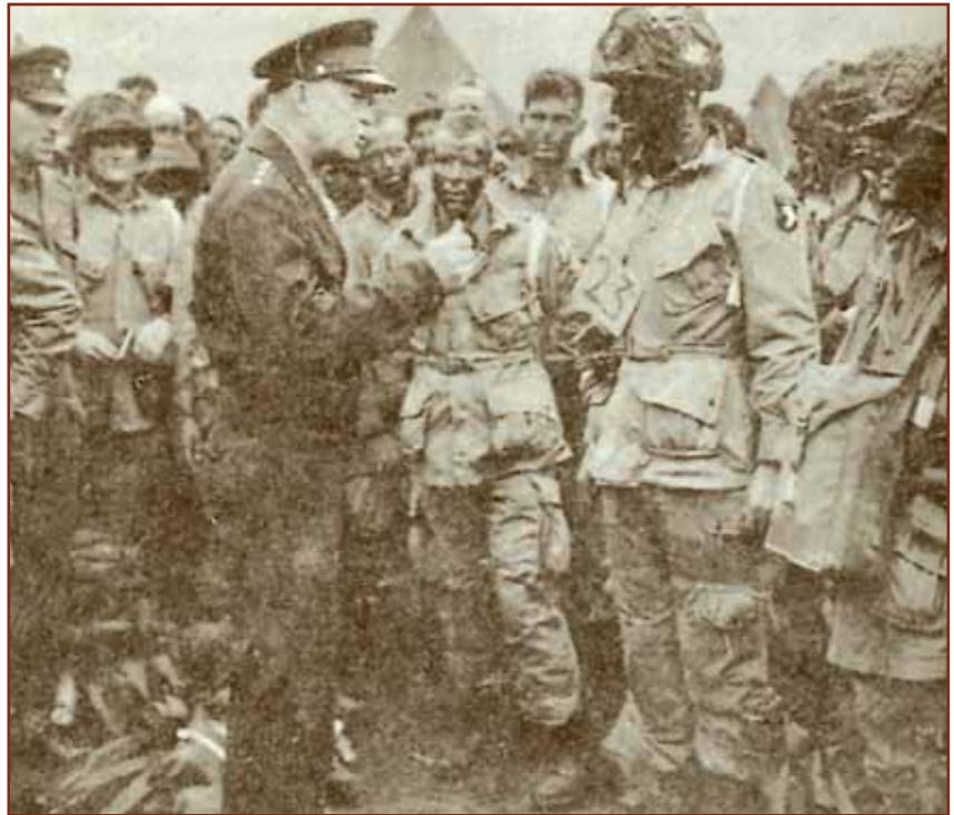
Το τελευταίο σύνθημα του στρατηγού Αϊζενχάουερ στους αλεξιπτωτιστές "Full victory, nothing else...", "Ολοκληρωτική νίκη και μόνο αυτή"

Ο επικεφαλής μετεωρολόγος της R.A.F., επισμηναγός Στάνγκ, άρχισε την ενημέρωση. Επικρατούσε απόλυτη σιωπή και τα μάτια όλων ήσαν καρφωμένα επάνω του: «Κύριοι.... υπήρξαν ορισμένες ξαφνικές και αναπάντεχες εξελίξεις στην κατάσταση»,