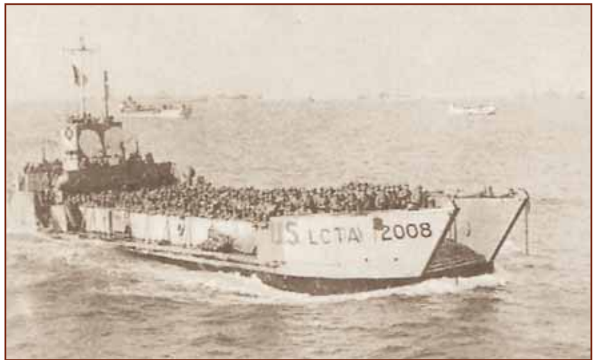
Ύστερα από τον φρικτό καιρο την παραμονή, ο ήλιος φάνηκε λαμπρός τη μέρα που έγινε η απόβα- ση και η θάλασσα γαλήνεψε

Η ομίχλη, σαν σάβανο, σκέπαζε τις ακτές της Νορμανδίας, εκείνο το πρω- ινό. Η βροχή έπεφτε συνεχώς. Πέρα από τις ακτές απλώνονταν ακανόνι- στα χωράφια, γεμάτα φράχτες. Πάνω