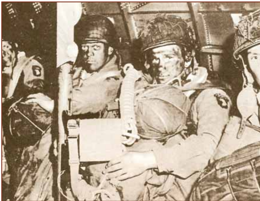
Αμερικανοί αλεξιπτωτιστές στοιβαγμένοι μέσα σε ανεμοπλάνο έχουν βάψει τα πρόσωπα τους στο χρώμα της νύχτας. Ένας ανάμεσα τους κρατάει περήφανος στα χέρια του ένα μπαζούκα

γές του, περισσότερους από μισό εκατομμύριο άνδρες που επάνδρωναν την αμυντική γραμμή κατά μήκος της ακτής, 1280 χλμ. Η κύρια δύναμή του, η 15η Στρατιά ήταν συγκεντρωμένη στο στενότερο σημείο της Μάγνης, ανάμεσα στη Γαλλία και την Αγγλία.