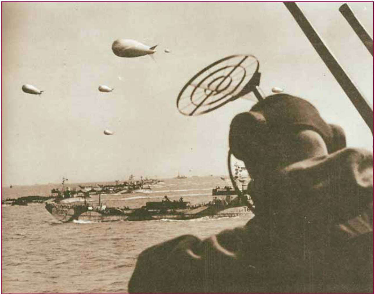
«Η φόρτωση η συγκέντρωση και μετακίνηση χιλιάδων πλοίων, θωρηκτών, καταδρομικών, τορπιλοβόλων, μεταγωγικών και κάθε είδους φορτηγίδων πραγματοποιήθηκε με τρόπο αριστοτεχνικό...» (Ουίνστον Τσώρτσιλ "Απομνημονεύματα").

έκρινε ότι μπορούσε να περιμένει μέχρι να ξυπνήσει. Όταν το είδε ο Γιοντλ τηλεφώνησε στον Ρούνστεντ ότι οι δύο μεραρχίες δεν μπορούσαν να μετακινηθούν χωρίς την άδεια του Χίτλερ που κοιμόταν. Ο Ρούνστεντ υπέκυψε, χωρίς να ζητήσει να τον ξυπνήσουν. Αηδισμένος «ένιπτε τας χείρας του». Ο «δεκανέας» θέλει να διοικεί μόνος τα στρατεύματά του, σιγομουρμούρισε.