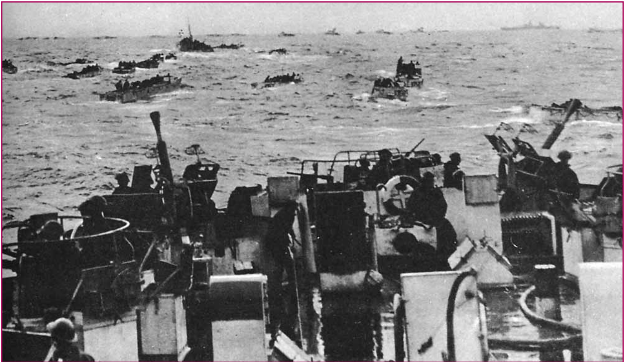
Τα Καναδικά τμήματα εφόδου πάτησαν πρώτα το πόδι τους στη γαλλική ακτή. Στη φωτογραφία μικρά αποβατικά σκάφη, απομακρύνονται από το πλοίο που τα μετέφερε και σπεύδουν προς το προκαθορισμένο σημείο.