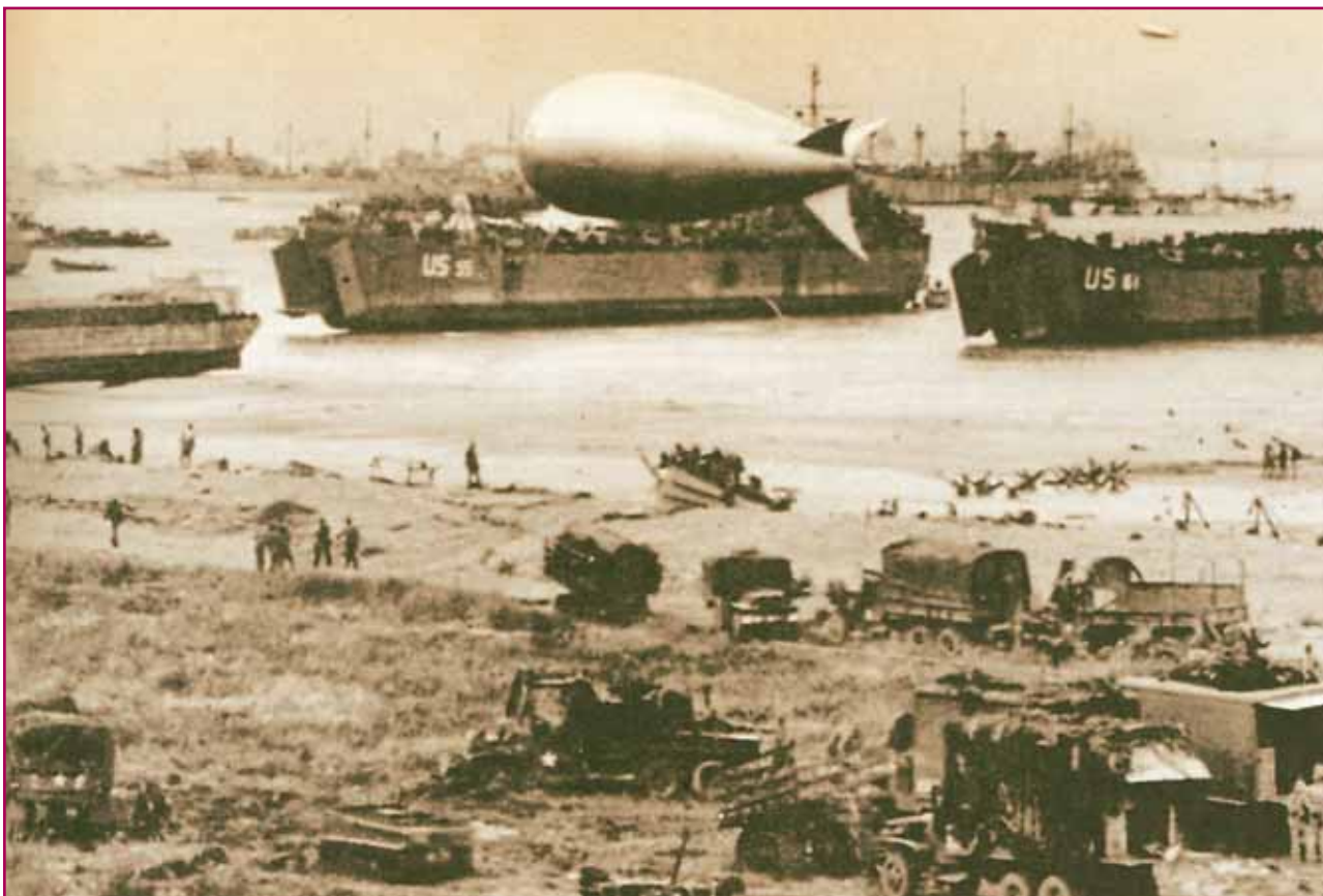
“Υπέροχο θέαμα, η πόλη αυτή των καραβιών, που απλωνόταν στο μήκος της ακτής, κάπου 80 χιλιόμετρα !” (Ουίνστον Τσώρτσιλ “Απομνημονεύματα”).

προϊσταμένου συνταγματάρχη από το τηλέφωνο ότι δεν γνωρίζει τι συμβαίνει, πήρε το λυκόσκυλό του και μαζί με άλλους δύο αξιωματικούς, του επιτελείου του, πήγαν στο προωθημένο αρχηγείο τους, ένα υπόγειο οχυρό παρατηρητήριο στους βράχους, πάνω από την ακτή, που αργότερα θα γινόταν γνωστή ως ακτή Ομάχα, κοντά στο Σαιντ Ονορίν. Με τα δυνατά κύαλια του πυροβολικού ερεύνησε με προσοχή το πέλαγος που έλαμπε από το δυνατό φεγγάρι, όταν δεν το κάλυπταν τα σύννεφα, χωρίς να παρατηρήσει τίποτα το ασυνήθιστο. «Δεν υπάρχει τίποτα έξω στη θάλασσα», τηλεφώνησε στο αρχηγείο του συντάγματος.