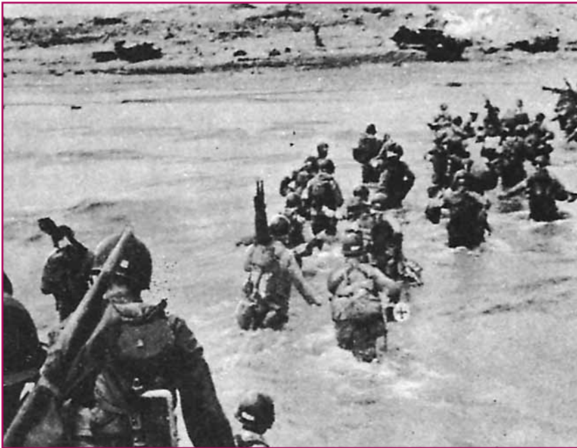
Μέσα στη θάλασσα ως τη μέση πορεύεται προς την ακτή, όπου δουλεύουν κιάλας οι μπουλντόζες.

από κει τρέχοντας πριν καλά-καλά σταματήσουν τα γυαλιά να πέφτουν.