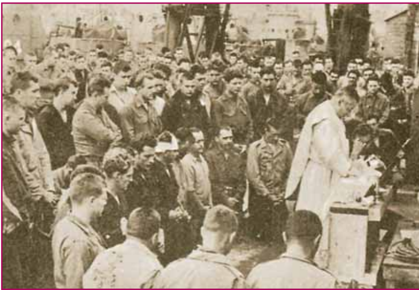
Πάνω στην αποβάθρα του Πλύμουθ, τη μεγάλη αυτή μέρα της 6ης Ιουνίου, ένας Αμερικανός πάστορ τελεί τη θεία λειτουργία. Στην ιστορική της αυτή εξόρμηση η Αμερική δεν παραμελούσε τις πνευματικές ανάγκες.

1 ώρα και 45 λεπτά για να πατήσουν την ακτή την ώρα Μηδέν (H Hour) που ήταν η 06.30.