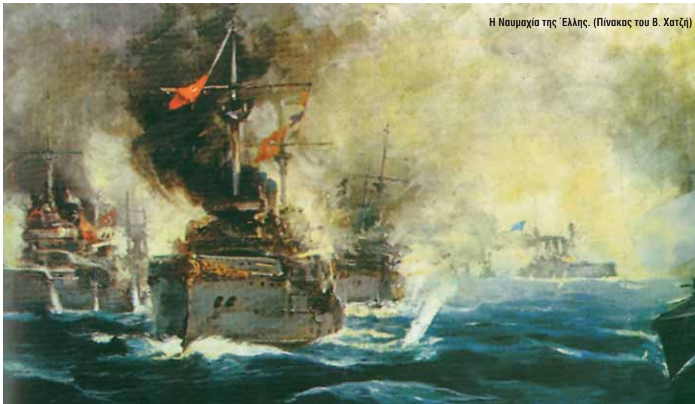
Η Ναυμαχία της Έλλης. (Πίνακας του Β. Χατζή)

Ε νενήντα τέσσερα χρόνια θα συμπληρωθούν στις 3 Δεκεμβρίου από την ημέρα της ναυμαχίας της Έλλης. Ο εορτασμός στη Σχολή Ναυτικών Δοκίμων μαζί με τη γιορτή του Αγίου Νικολάου θα υπενθυμίσει το ένδοξο γεγονός που στα χρόνια της πραγματοποίησής του συγκίνησε βαθύτατα την ελληνική ψυχή.