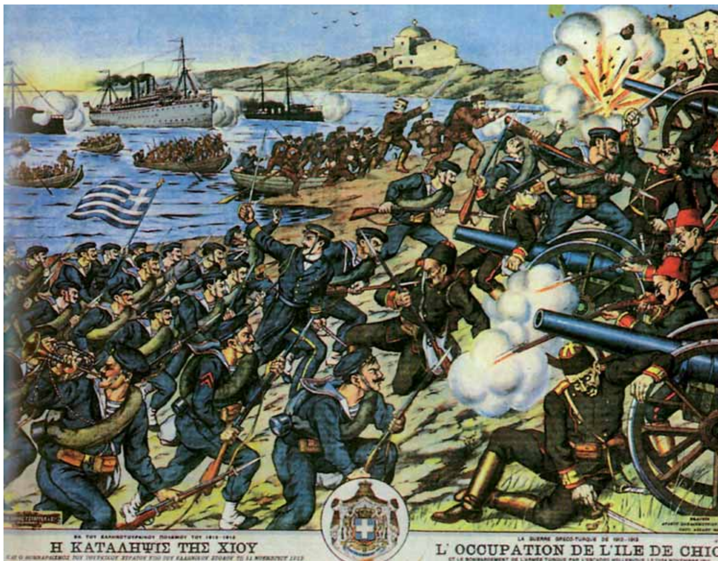
Η απελευθέρωση της Χίου από άγημα Ελλήνων πεζοναυτών. (Λαϊκή λιθογραφία εποχής)

λύ. Μια απέραντη γαλήνη απλώνεται στην ατμόσφαιρα. Ο ελαφρύς νοτιάς ρυτιδώνει ελαφρά τη θάλασσα. Όλα προμηνύουν ότι θα είναι μια ηλιόλουστη μέρα. Η ελαφρά ομίχλη εμποδίζει την ορατότητα. Ο Στόλος μας, σχηματισμένος σε δυο παράλληλες στήλες από τις οποίες την αριστερή συγκροτούν τα θωρηκτά, κατά σειρά, «Αβέρωφ», «Σπέτσει», «Υδρα» και «Ψαρά», και τη δεξιά τα αντιτορπιλικά «Λέων», «Αετός», «Πάνθηρ» και «Ιέραξ», έχει πορεία νοτιοδυτική. Στο βάθος ο σκούρος όγκος της χερσονήσου της Καλλίπολης κατεβαίνει ομαλά προς το νοτιά, μέχρι το ακρωτήριο της Ελλάς. Οι άνδρες των πολεμικών μας, κοίτη κατάκοποι από την προηγηθείσα 48ωρη περιπολία, με τα μάτια καρφωμένα στα Στενά, προσπαθούν να διακρίνουν τι ακριβώς συμβαίνει στην άκρη του Ελληνισπόντου.