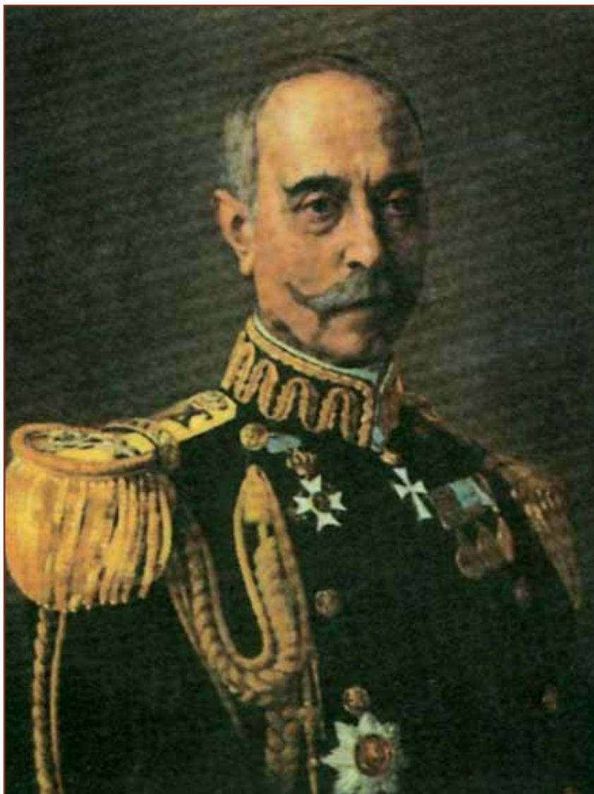
Ο ναύαρχος Π. Κουντουριώτης, Αρχηγός Στόλου στους Βαλκανικούς Πολέμους