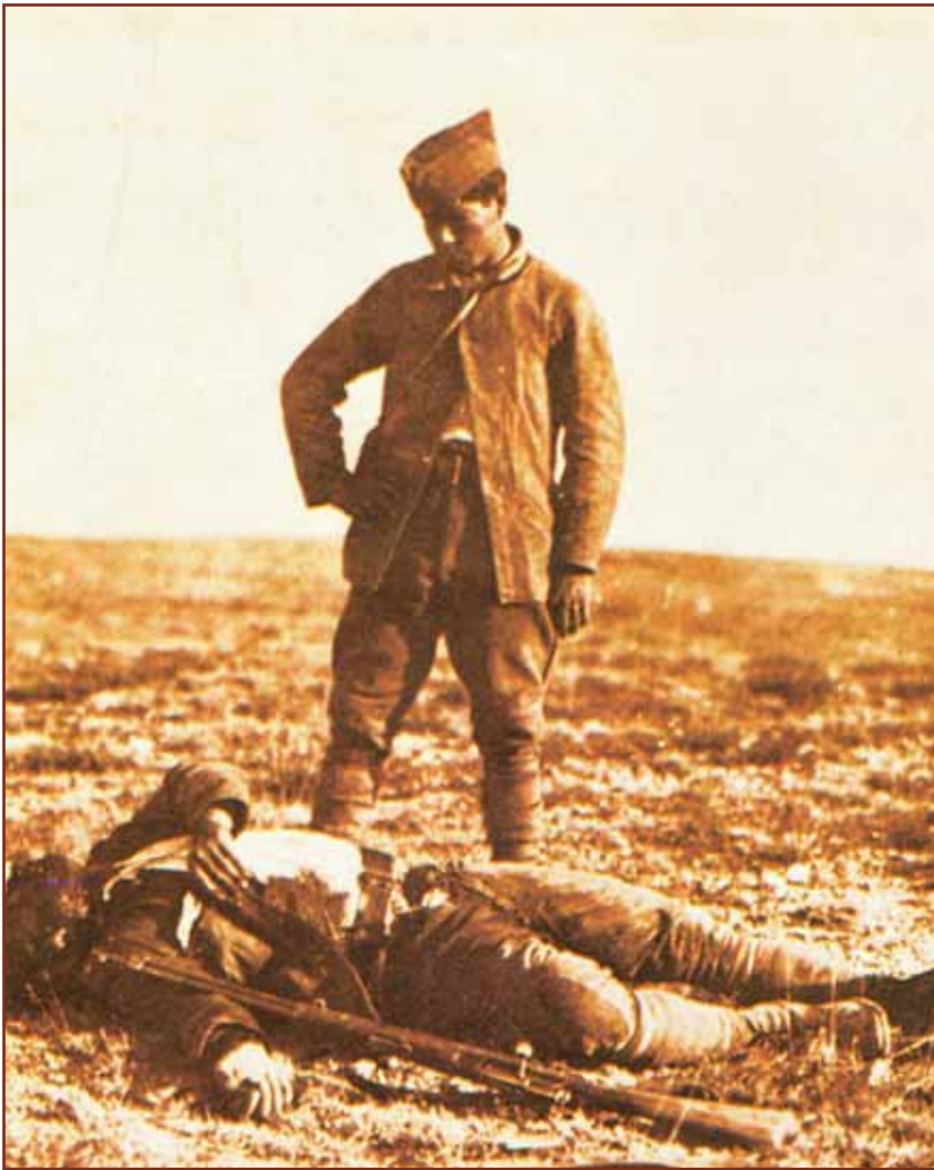
Έλληνας στρατιώτης μπροστά σε νεκρό συνάδερφό του.

ναρης αναλαμβάνει πρωθυπουργός και αποφασίζει να εκβιάσει δυναμική λύση στη Μικρά Ασία. Στα μάτια της κοινής γνώμης θα μπορούσε να δικαιολογηθεί μία παράταση των εχθροπραξιών με στόχο την επιβολή της διεθνούς νομιμότητας, εφόσον το Κεμαλικό Κίνημα είχε απορρίψει στο σύνολό της, ως απαράδεκτη, τη Συνθήκη των Σεβρών. Πρόκειται για μία θεαματική μεταστροφή, ενώ παραμερίζονται συνειδητά ορισμένες προκαταλήψεις έναντι των Συμμάχων. Τα πράγματα όμως είναι διαφορετικά, όχι μόνο από πλευράς εξωτερικών παραγόντων, αλλά και εσωτερικών. Το έθνος δεν μάχεται πλέον ενωμένο, αλλά γίνεται μεγάλη προπαγάνδα, μέσα στο στράτευμα από αντιπολιτευτικούς παράγοντες, ο στρατός είναι κουρασμένος να πολεμά 10 χρόνια, από το 1912, και ο αγώνας είναι κρισιμότερος.