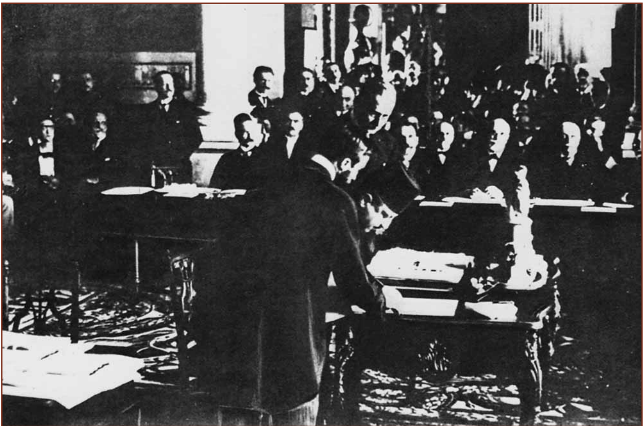
Υπογραφή της συνθήκης των Σεβρών (10 Αυγούστου 1920).

Τουρκίας και παρουσιάζονταν δυσεπίλυτα προβλήματα ανεφοδιασμού και μεταφορών, υγειονομικής περίθαλψης και διακομιδών, οργάνωσης, φρούρησης και συντήρησης μεγάλου μήκους συγκοινωνιών και εξασφάλισης μεγάλων εκτάσεων των μετόπισθεν με μικρές δυνάμεις. Οι αρμόδιοι επιτελείς επισήμαιναν τις αδυναμίες, αλλά ο Στρατός προχωρούσε.