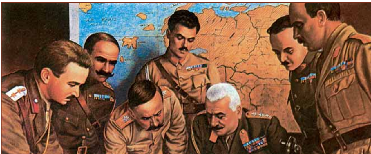
Ο αρχιστράτηγος Λ Παρασκευόπουλος και ο στρατηγός Θ Πάγκαλος (σκυφτός δίπλα του) μελετούν χάρτη επιχειρήσεως.

στους Συμμάχους μεταξύ των οποίων το χάσμα διευρύνεται. Η Βρετανία εμμένει στην ιδέα της διαμεσολάβησης για λύση του Μικρασιατικού και η Γαλλία τηρεί στάση ολοένα και πιο ενδοτική έναντι του Κεμάλ. Ωστόσο μια νέα πρωτοβουλία εκδηλώνεται το Μάρτιο, δυσμενέστατη για τα ελληνικά πράγματα καθόσον μιλούσαν για σύμπτυξη των συνόρων στην Ανατ. Θράκη, κατάργηση του διεθνούς καθεστώτος της Κωνσταντινούπολης, ελεύθερη ναυσιπλοΐα στα Στενά και πλήρη αποχώρηση του Ελληνικού Στρατού από τη Μικρά Ασία. Χωρίς περιθώρια επιλογής η ελληνική κυβέρνηση αποδέχεται το συμμαχικό σχέδιο, προκαλώντας θύελλα αντιδράσεων στην Αθήνα.