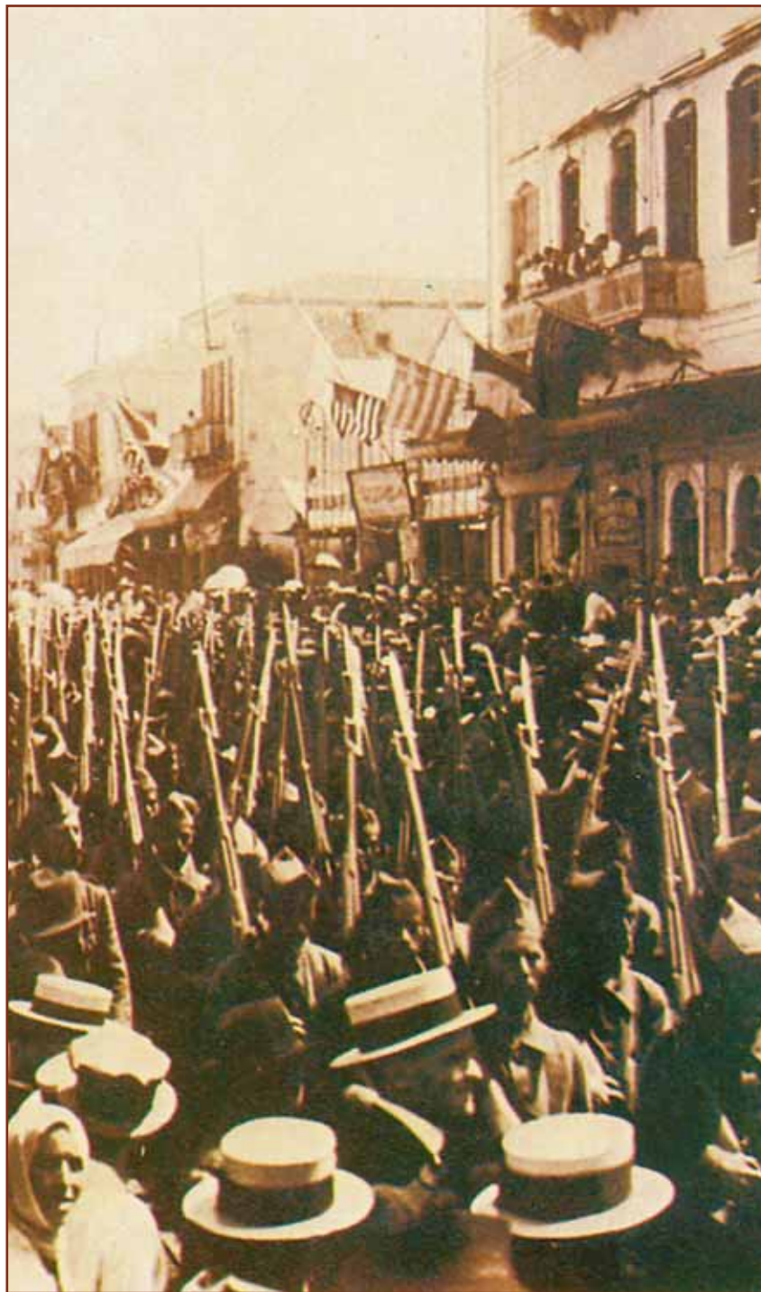
Θερμή υποδοχή του Ελληνικού Στρατού στη Σμύρνη (2 Μαΐου 1919)

Η φτωχή και κατάξερη από βράχους Ελλάδα, που ο μισός πληθυσμός της μετανάστευε τότε, γονάτισε οικονομικά για να μπορέσει να αφομοιώσει το μεγάλο προσφυγικό κύμα. Οι ίδιοι όμως οι πρόσφυγες δεν κουράστηκαν να κυνηγούν τη νέα τους ζωή. Στις φλέβες τους κυλούσε αίμα ικανό για τη δημιουργία μιας νέας μορφής πολιτισμού, μιας καινούργιας πνευματικής ζωής, μιας επιχειρηματικής κατάκτησης. Μικρασιάτης ήταν ο πρώτος μας μεγαλοεφοπλιστής, ο Ωνάσης. Μικρασιάτης ο πρώτος μεγαλοβιομήχανος ο Μποδοσάκης και το πρώτο Νόμπελ της Ελλάδος, ο Γ. Σεφέρης.