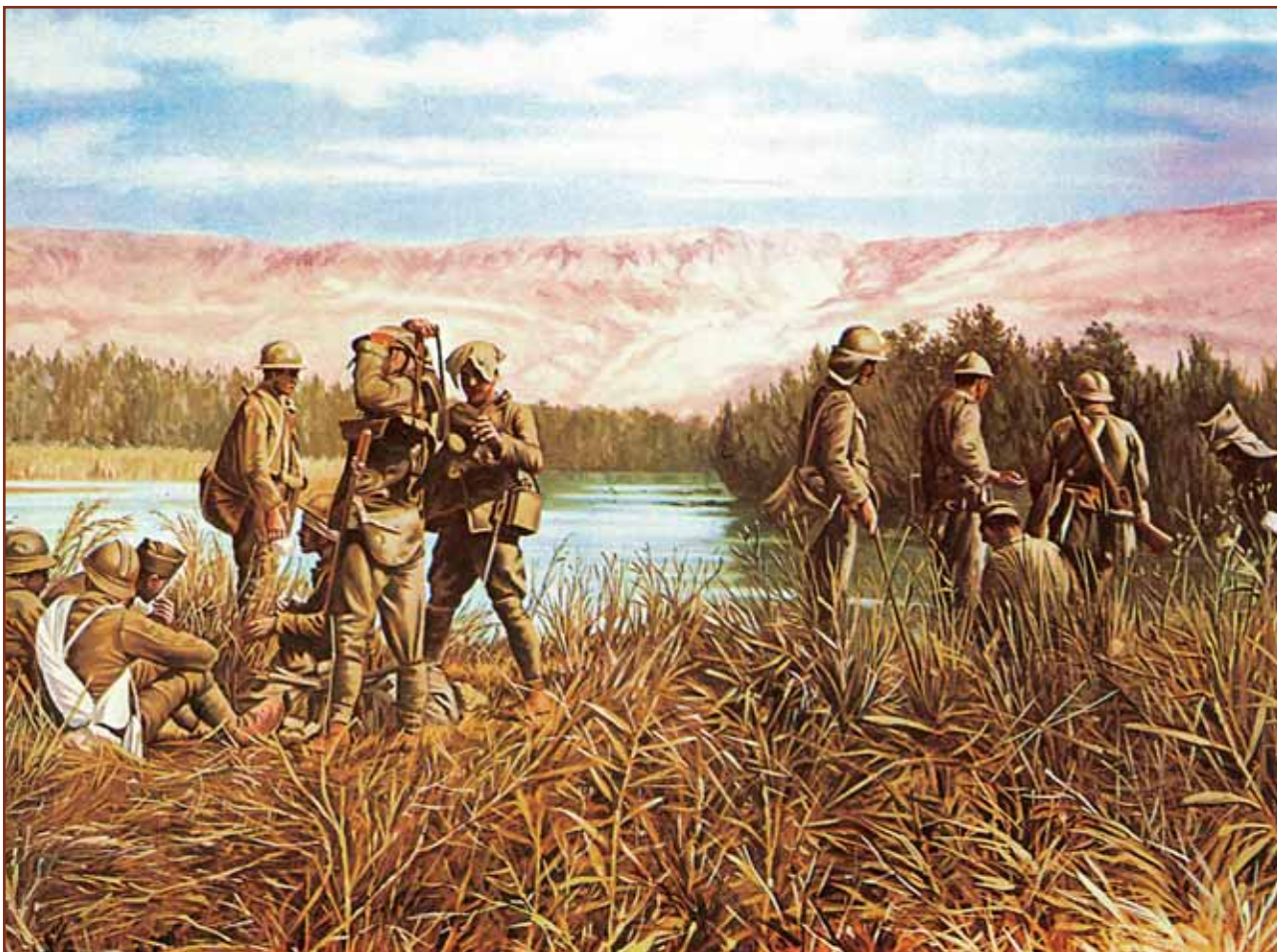
Έλληνες Στρατιώτες στο Σαγγάριο (Αύγουστος 1921).

του Αντιναυάρχου (ε.α.), ΞΕΝΟΦΩΝΤΟΣ ΜΑΥΡΟΓΙΑΝΝΗ