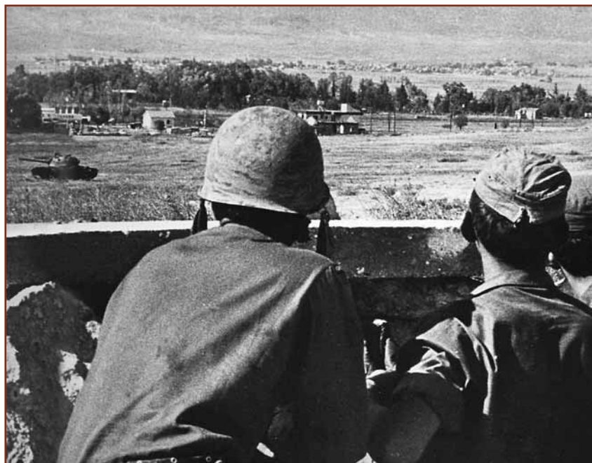
Στο πεδίο της μάχης (από την έκδοση του ΥΕΘΑ «ΓΙΑ ΤΗΝ ΚΥΠΡΟ»).

Οι περιουσίες και τα σπίτια των Ελληνοκυπρίων στα κατεχόμενα, παράνομα έχουν περιέλθει όλα αυτά τα χρόνια στα χέρια των Τούρκων εποίκων οι οποίοι τα εκμεταλλεύονται και τα μοσχοπουλάνε σε αλλοδαπούς. Προκλητική θα μπορούσε να χαρακτηριστεί απόφαση του Ανωτάτου Δικαστηρίου της Βρετανίας που πάρθηκε στις 6 Σεπτεμβρίου 2006 για τις ελληνοκυπριακές περιουσίες. Το ζεύγος των Βρετανών Όραμς είχε καταδικαστεί από κυπριακό δικαστήριο για την παράνομη κατοχή της ιδιοκτησίας του Μελέτη Αποστολίδη στην κατεχόμενη Λάπηθο όπου το ζεύγος έκτισε πολυτελή έπαυλη και διαμένει τα τελευταία χρόνια. Οι Όραμς με δικηγόρο τη Σέρι Μπλερ –σύζυγο του