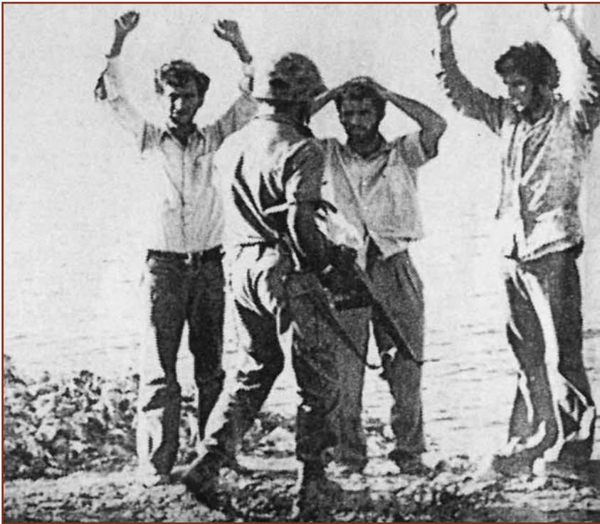
Η τύχη 1619 Ελληνοκυπρίων και Ελλαδιτών εξακολουθεί να αγνοείται (από την έκδοση του ΥΕΘΑ «ΓΙΑ ΤΗΝ ΚΥΠΡΟ»).