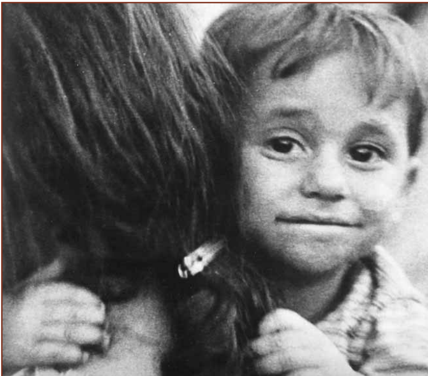
Πόσες πηλγές υπάρχουν στην ψυχή αυτού του παιδιού; (από την έκδοση του ΥΕΘΑ «ΓΙΑ ΤΗΝ ΚΥΠΡΟ»).

Ο αείμνηστος Σπ. Μαρκεζίνης γράφει στην ιστορία του: «Από το 1922, αρχίζει εντελώς νέα – μοναδική δε – περίοδος ελληνικής ιστορίας. Έως τότε η Ελλάς είχε συνήθως δισπύσσον ύπαρξιν. Ελλάς ελευθέρα και Ελ-