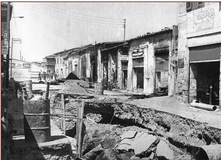
Ληλασίες και καταστροφές (από την έκδοση του ΥΕΘΑ «ΓΙΑ ΤΗΝ ΚΥΠΡΟ»).

με σύγχρονα μέσα και με περισσότερα από 200 άρματα μάχης και την υποστήριξη της πολεμικής τους αεροπορίας που δεν είχε αντίπαλο, δεν άφησαν τίποτα όρθιο.