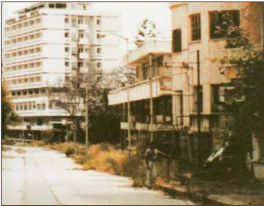
Αμμόχωστος. Η πόλη φάντασμα (από την έκδοση του ΥΕΘΑ «ΓΙΑ ΤΗΝ ΚΥΠΡΟ»).