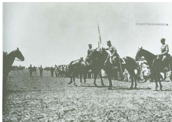
Επίσημη παράδοση σημαία στο 2ο Σύνταγμα ιππικού, 3 Ιουλίου 1922. Διακρίνεται ο μέραρχος Ανδρέας Καλλίνσκης και ο επιτελάρχης αντισυνταγματάρχης ιππικού Αλέξανδρος Παπάγος.