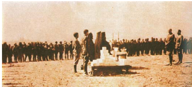
Ο πανηγυρισμός, μετά τη νίκη, τον Ιούλιο του 1921 στο Εσκή Σεχίρ. Κάτω ο βασιλεύς προσκυνάει το ιερό Ευαγγέλιο μετά τη δοξολογία. (Φωτ. : «ΕΛΛΑΔΑ 20ος αιώνας, Β Τόμος, Τα γεγονότα, Εκδόσεις ΑΠΟΓΕΥΜΑΤΙΝΗ Α.Ε.»).

Η Μικρασιατική καταστροφή μπορεί να χαρακτηριστεί μεγαλύτερη ακόμη και από την άλωση της Κωνσταντινούπολης το 1453 και την πτώση του Βυζαντίου, γιατί, ενώ επί χιλιάδες χρόνια ο Ελληνισμός βρισκόταν και από τις δύο ακτές του Αιγαίου (Άσπρης Θάλασσας), μετά από την ήττα στη Μικρά Ασία μεταφέρθηκε μόνο στη μία, δημιουργώντας χρόνια προβλήματα που αντιμετωπίζουμε και επί των ημερών μας. Το Ελληνικό Έθνος έχασε τη διφυή ύπαρξή του, την εκφραζόμενη στις έννοιες Ελληνισμός και Ελλαδισμός, και περιορίστηκε στη δεύτερη για να καταπλήξει με την ταχεία αφομοίωση των προσφύγων και με τη νέα ανάταση στο Αλβανικό έπος.