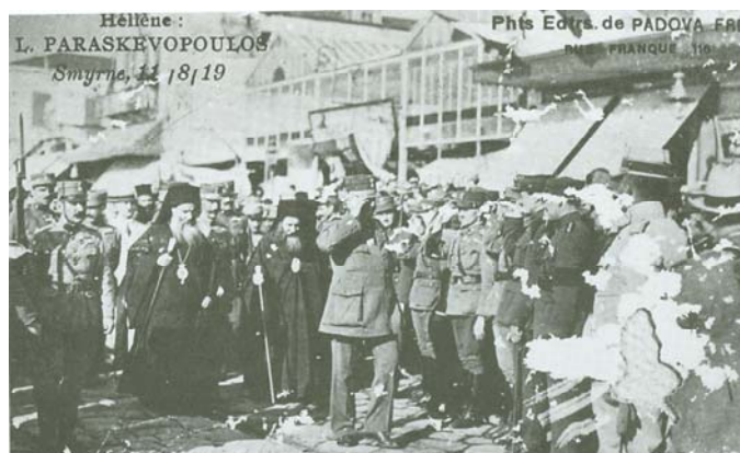
Ο αρχιστράτηγος Λεωνίδας Παρασκευόπουλος κατά τη διάρκεια τελετής στη Σμύρνη, 11 Αυγούστου 1919