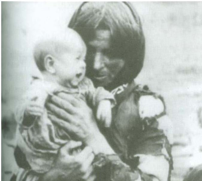
Η απόγνωση και ο πόνος έχουν χαράξει ανεπανόρθωτα την ψυχή των προσφύγων