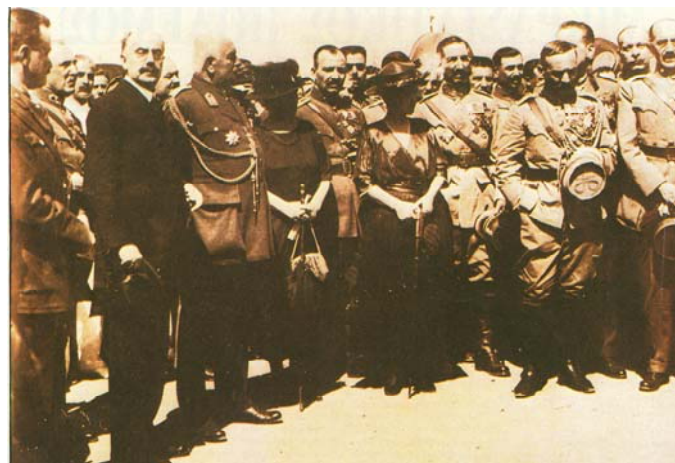
Ο Ύπατος Αρμοστής Σμύρνης Αριστείδης Σεργιάδης (τρίτος από αριστερά με πολιτική ενδυμασία) του οποίου ο ρόλος υπήρξε αμφιλεγόμενος. Στη φωτ., με ανώτατους αξιωματικούς του Στρατεύματος (τρίτος από δεξιά ο Πάγκαλος). (Φωτ. : «ΕΛΛΑΔΑ 20 ος αιώνας, Β Τόμος, Τα γεγονότα, Εκδόσεις ΑΠΟΓΕΥΜΑΤΙΝΗ Α.Ε.»).