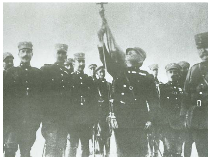
Ο στρατηγός Αλέξανδρος Μαζαράκης-Αινιάν παρασημοφορεί τη σημαία, 1919