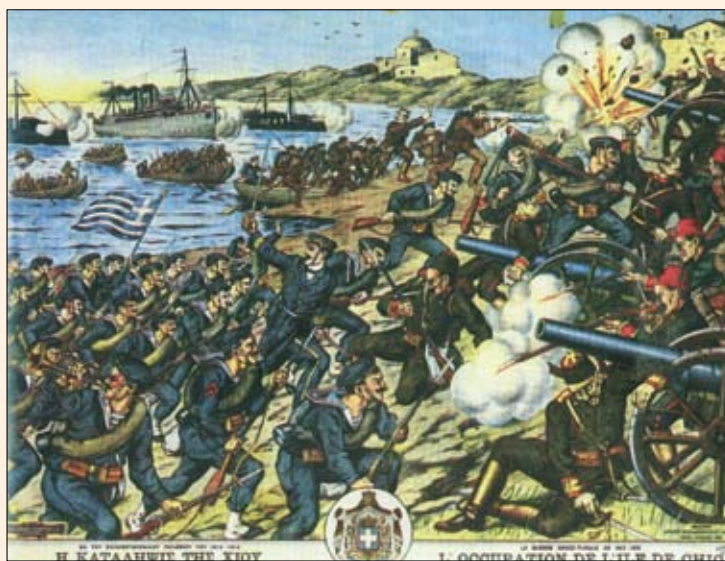
Η απελευθέρωση της Χίου από Έλληνες πεζοναύτες (λαϊκή λιθογραφία εποχής).

Ο Ed. Froster γράφει: «Το Ελληνικό Ναυτικό υπό τον ναύαρχο Κουντουριώτη προσέφερε κατά τη διάρκεια του πολέμου ανεκτίμητες υπηρεσίες... Η μεγαλύτερη συμβολή του στη συμμαχική νίκη ήταν ότι εμπόδισε την αποστολή ενισχύσεων από τη Μ. Ασία διά θαλάσσης...», ενώ συγχρόνως