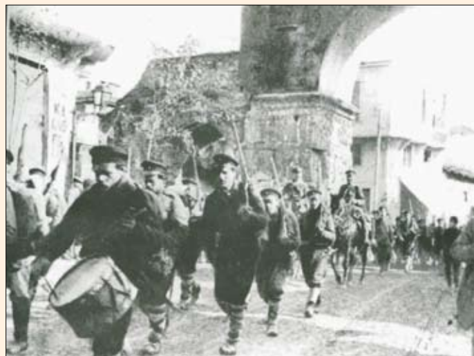
Τα βουλγαρικά στρατεύματα εισέρχονται στη Θεσσαλονίκη.