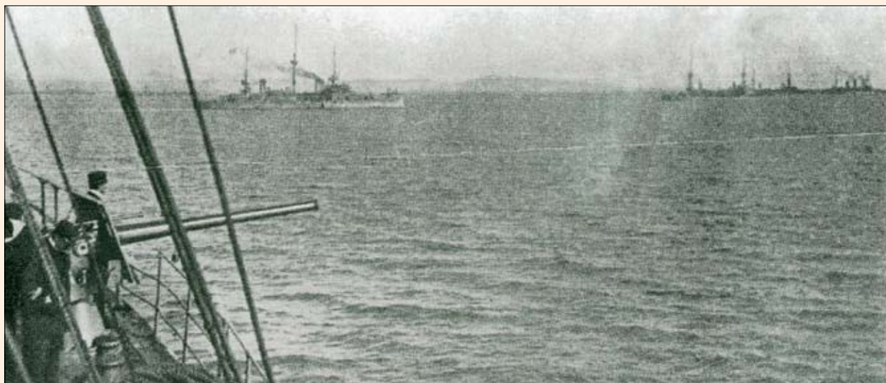
Τα ελληνικά θωρηκτά παρέχουν από θαλάσσης υποστήριξη των αποβατικών βουλγαρικών στρατευμάτων στην Αλεξανδρούπολη (Δεδέ Αγάτς).

Άξιο ιδιαίτερας μνείας είναι η μεταφορά της 4 ης και 6 ης ελληνικών μεραρχιών από Θεσσαλονίκη προς Πρέβεζα για