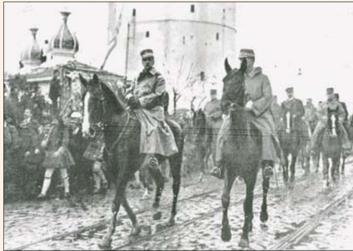
Ο Βασιλεύς Γεώργιος Α΄, ο διάδοχος Κωνσταντίνος, ακολουθούμενοι από τους άλλους γιους και εγγονούς του βασιλέως και από το επιτελείο του, εισέρχονται στην πόλη της Θεσσαλονίκης στις 11 Δεκεμβρίου του 1912 (φωτ. από το βιβλίο του Α. Δημητρακόπουλου «Ο ΠΡΩΤΟΣ ΒΑΛΚΑΝΙΚΟΣ ΠΟΛΕΜΟΣ ΜΕΣΑ ΑΠΟ ΤΙΣ ΣΕΛΙΔΕΣ ΤΟΥ ΠΕΡΙΟΔΙΚΟΥ 'ILLUSTRATION'»).

• Τα νησιά του Αιγαίου (πλην Ίμβρου, Τενέδου) που απελευθέρωσε ο Ελληνικός Στόλος θα διανεμόταν μεταξύ των νικητών. Για την τύχη τους θα αποφάσιζαν οι Μεγάλες Δυνάμεις. Το ίδιο θα συνέβαινε και για το Άγιο Όρος.