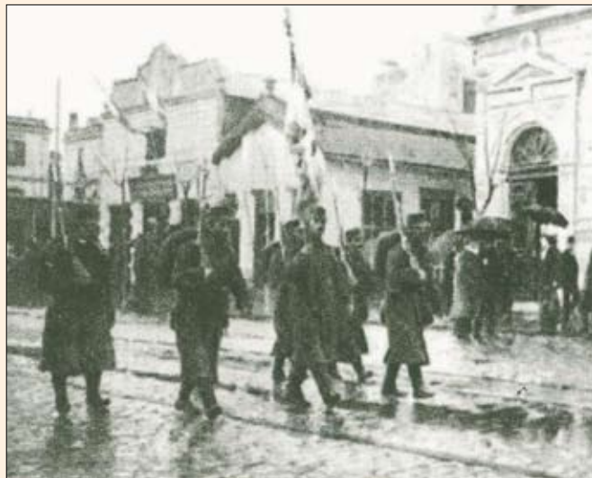
Ο ελληνικός στρατός εισέρχεται στη Θεσσαλονίκη.