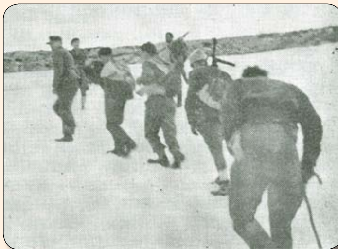
Μέλη της ομάδος απαγωγής με τον αιχμάλωτο Στρατηγό Κράιπε, στις χιονισμένες κορφές του Ψηλορείτη.

Η 4η Μαΐου ξημέρωσε με μια εκτυφλωτική αυγή πάνω από την κορυφογραμμή του Ψηλορείτη. Το πυροβολικό ξανάρχισε να βομβαρδίζει τις ρεματιές και τα χωριά ώστε να αποκλεισθεί κάθε πιθανότητα διαφυγής των Βρετανών. Μία αιφνιδιαστική επίθεση των ανταρτών σε πολλά σημεία αιφνιδιάζει τους Γερμανούς οι οποίοι για να ανασυνταχθούν αναγκάζονται να αποσύρουν τις περιπόλους τους από τη Φανερωμένη. Οι απαγωγείς ξεγλιστρούν, κυριολε-