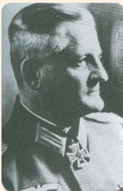
Ο Γερμανός Στρατηγός Κράιπε.

Το ίδιο βράδυ κατέφθανε στη Νεάπολη Κρήτης στο στρα-