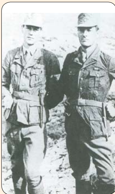
Οι Βρετανοί κομάντος Πάτρικ Λη Φέρμορ (δεξιά) και Στάνλεϋ Μος (αριστερά), Αρχηγός και Υπαρχηγός της ομάδας απαγωγής, ντυμένοι ως Γερμανοί δεκανείς της Στρατιωτικής Αστυνομίας, λίγο πριν από την ενέργεια.

Σύμφωνα με το σχέδιο οι τέσσερις καταδρομείς θα ρίχνονταν με αλεξίπτωτα στην Κρήτη σε ελεγχόμενη από τους αντάρτες περιοχή, για αναγνώριση της περιοχής του Ηρακλείου, καθορισμό του δρομολογίου διαφυγής μέσω των βουνών και μονοπατιών, συγκέντρωση πληροφοριών για τις συνθήκες του