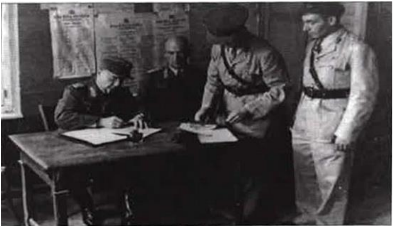
Υπογραφή του πρωτοκόλλου παράδοσης των Δωδεκανήσων στους Συμμάχους από τον αρχηγό των γερμανικών δυνάμεων κατοχής στρατηγό Wagener στον Άγγλο ταξίαρχο Moffat, στις 8 Μαΐου 1945 στη Σύμη.