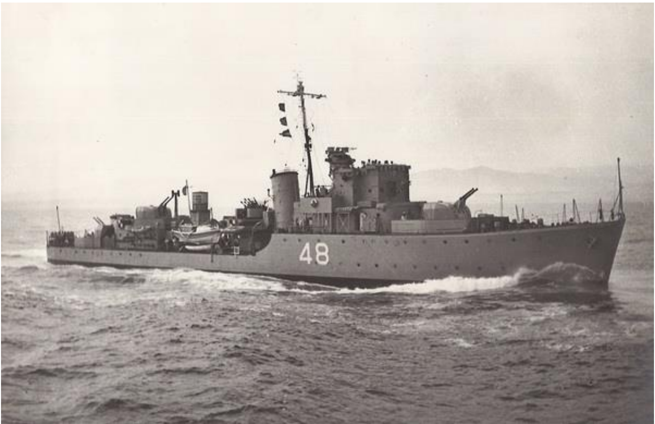
Το Α/Τ ΚΡΗΤΗ

Σύμη, 8 Μαΐου 1945: Ο Στρατηγός Όττο Βάγκνερ (Otto Wagener), Διοικητής των Δυνάμεων του Άξονος στο Νοτιοανατολικό Αιγαίο, μεταβαίνει για να υπογράψει την παράδοση των Δωδεκανήσων στους Συμμάχους. (Έχει δημοσιευθεί στο βιβλίο του ΓΙΑΝΝΟΠΟΥΛΟΥ Α. Αντιτορπιλικό «ΚΡΗΤΗ» - Η Ιστορία ενός Πλοίου στον Πόλεμο (1943-1945))