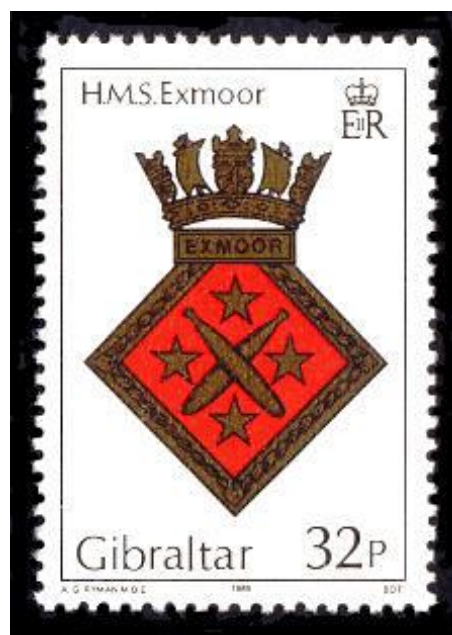
Ο θυρεός του HMS Exmoor