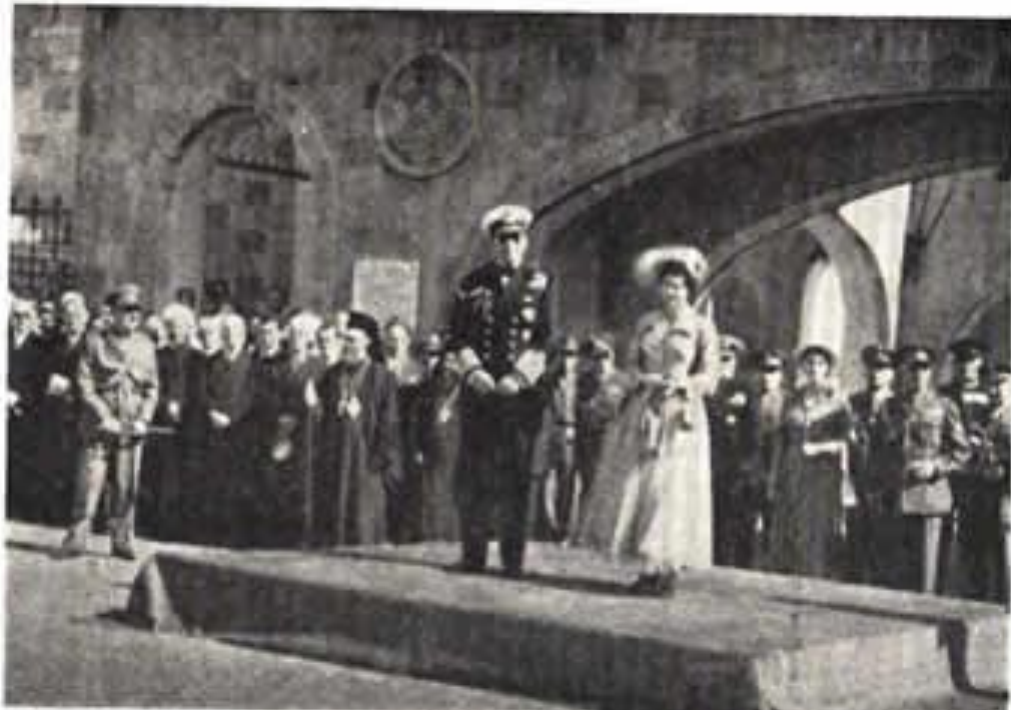
Ο Βασιλεύς Παύλος και η Βασίλισσα Φρειδερίκη παρακολουθούν την παρέλαση.