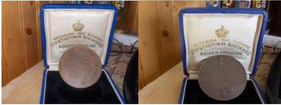
Το μετάλλιο που κατασκευάστηκε με αφορμή την ύψωση της Ελληνικής Σημαίας στα Δωδεκάνησα από τον Ναύαρχο Περικλή Ιωαννίδη

ΟΛΟΠΟΡΙΚΟ στην ιστορία της Ρόδου μέσα από τους δρόμους της