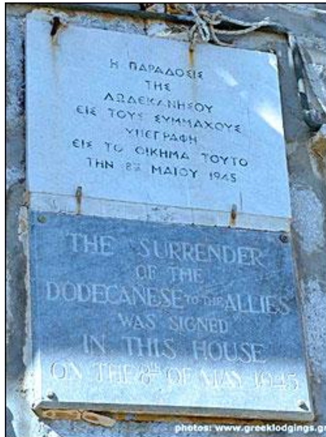
Η πλάκα έξω από το κτίριο που υπογράφηκε η Συμφωνία