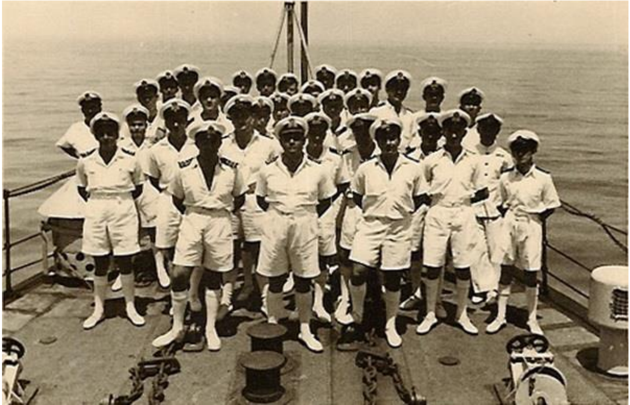
Ο Κυβερνήτης του Α/Τ ΚΡΗΤΗ, Πλωτάρχης (τότε) Ιάσων Θεοφανίδης εν μέσω Αξιωματικών και Υπαξιωματικών του πλοίου (~1945)