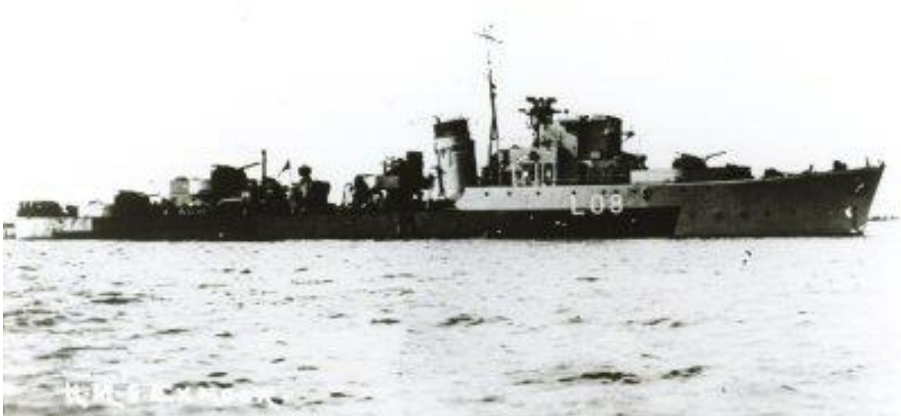
To HMS Exmoor