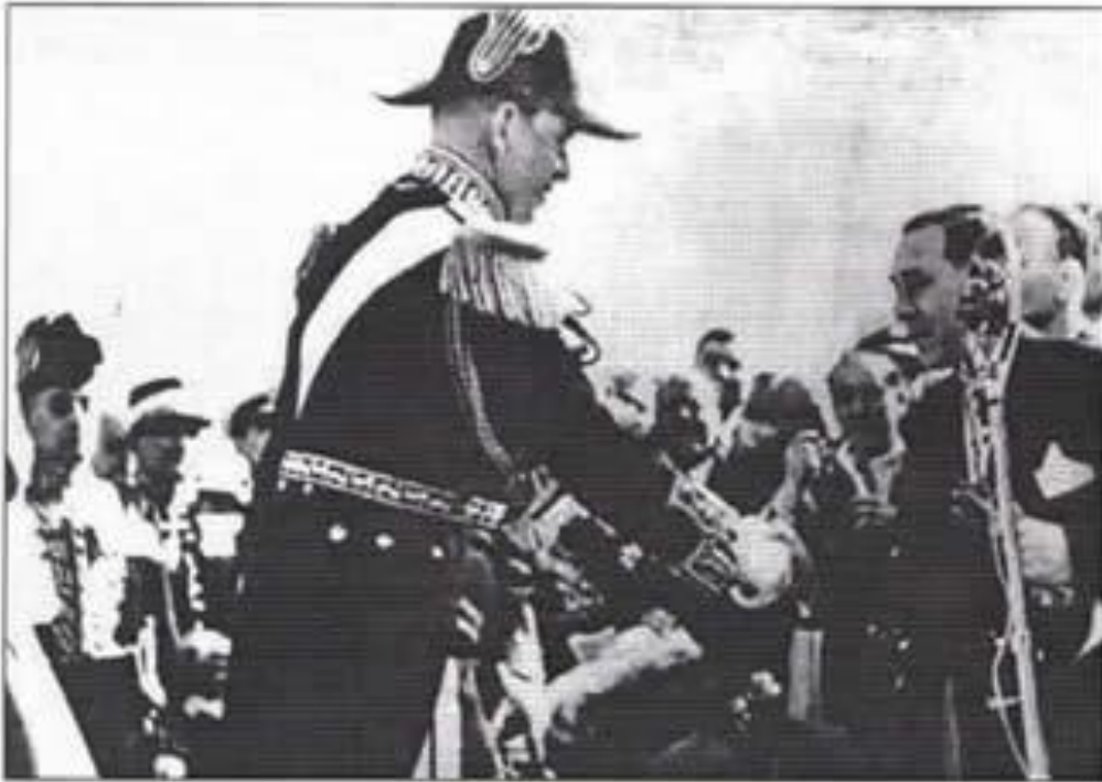
Ο δέσποτης Γεωργίου Χαρίτος καλλιτορξίει το βασιλιά Παύλο Α΄.