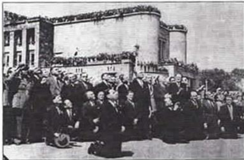
Λαός και επίσημοι, γονατιστοί, παρακολουθούν την ανέγωση της ελληνικής σημαίας.