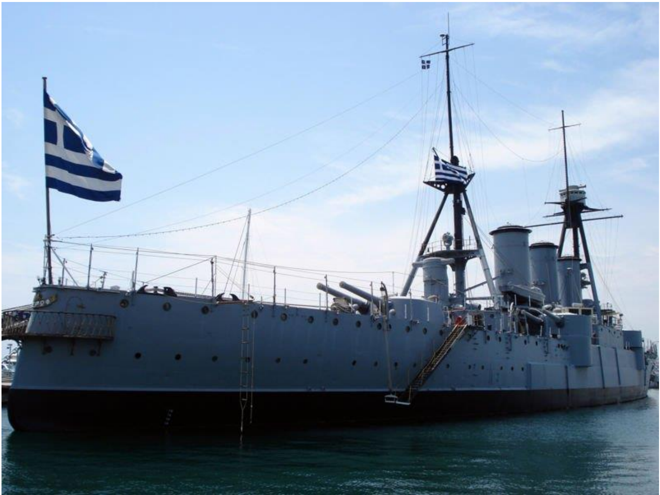
Το θωρηκτό Γεώργιος Αβέρωφ Σήμερα βρίσκεται στο Ναυτικό πάρκο στο Τροκαντερό του Παλαιού Φαλήρου.