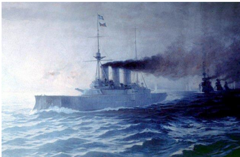
Βασ. Χατζής, «Η ναυμαχία της Έλλης, 13 Δεκεμβρίου 1912» (π. 1913). Ελαιογραφία. Ναυτικό Μουσείο Ελλάδας.

Η ναυμαχία της Έλλης στις 3/16 Δεκεμβρίου 1912, ήταν η πρώτη από τις δύο κορυφαίες μάχες μεταξύ του Ελληνικού Πολεμικού Ναυτικού και του Οθωμανικού Στόλου κατά τον Α' Βαλκανικό Πόλεμο και πραγματοποιήθηκε στην έξοδο των στενών των Δαρδανελίων (ή Ελλησπόντου). Η ναυμαχία έληξε με τη νίκη του Ελληνικού στόλου και τον εγκλεισμό του Οθωμανικού εντός των στενών.