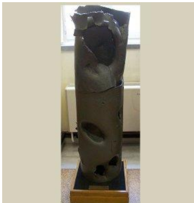
Ο φορτωτήρας του Θωρηκτού Αβέρωφ, διάτρητος από τα εχθρικά πυρά. Εθνικό Ιστορικό Μουσείο Αθηνών.

Η πρώτη Τουρκική μοίρα, που βγαίνοντας από τα Στενά έστριψε προς την Τένεδο, χωρίς να ακολουθήσει τα θωρηκτά, συνάντησε ομάδα Ελληνικών πλοίων και επέστρεψε στον Ελλήσποντο μετά από μια μικρή ανταλλαγή πυρών.