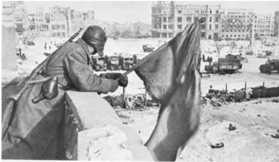
Στάλινγκραντ: όλη η πόλη ένα πεδίο μάχης

Πριν αρχίσει η επιχείρηση των βασικών δυνάμεων στο νοτιοδυτικό τομέα – και προς διευκόλυνσή τους – οι Γερμανοί ξεκίνησαν μικρότερες επιχειρήσεις στην Κριμαία, στην περιοχή του Χάρκοβου, στο δυτικό και στο βορειοδυτικό τομέα. Έτσι από το Μάιο άρχισαν οι επιθετικές επιχειρήσεις σε μια σειρά τομείς του σοβιετογερμανικού μετώπου από το Λένινγκραντ έως την Κριμαία. Ταυτόχρονα, το Μάιο – Ιούνιο του 1942 στο νοτιοδυτικό τομέα ο εχθρός κατάφερε να εξασφαλίσει την πρωτοβουλία, να μειώσει την έκταση του μετώπου του και να καταλάβει πιο ευνοϊκές θέσεις για την επόμενη φάση της πολεμικής του εξόρμησης. Η ήττα των σοβιετικών στρατευμάτων στη χερσόνησο Κερτς και νοτιοδυτικά από το Χάρκοβο, η υποχώρησή τους στον τομέα του Βολτσάνσκ και του Κουπιάνσκ χειροτέρευσε κατά πολύ την κατάσταση σε όλη τη νότια πτέρυγα του μετώπου και ο Κόκκινος Στρατός ξαναπέρασε στο στάδιο των αμυντικών ενεργειών.