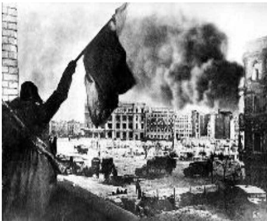
Η κόκκινη σημαία πάνω από το Στάλινγκραντ

Στις 20 του Φεβρουαρίου του 1943 ο στρατηγός Χάιντς Γκουντέριαν συναντήθηκε με τον Αδόλφο Χίτλερ. «Είχα να τον δω – γράφει στα απομνημονεύματά του 1 - από την αποφράδα εκείνη ημέρα της 20ής Δεκεμβρίου 1941 (σ.σ. μετά την ήττα των γερμανικών δυνάμεων στη Μόσχα, που είχε ως αποτέλεσμα ο Γκουντέριαν να πέσει σε δυσμένεια). Στους 14 μήνες που είχαν περάσει από τότε ο Χίτλερ είχε γεράσει πολύ. Το όλο παρουσιαστικό του δεν ήταν πια τόσο επιβλητικό, όπως τότε. Η ομιλία του ήταν διστακτική και το αριστερό του χέρι έτρεμε». Ο γνωστός ακροδεξιός ιστορικός συγγραφέας David Irving συμπληρώνει ότι πέρα από τα άλλα προβλήματα υγείας «ο Χίτλερ περνούσε κρίσεις βαριάς κατάθλιψης... Το Στάλινγκραντ είχε αφήσει βαθιά σημάδια μέσα του» 2 .