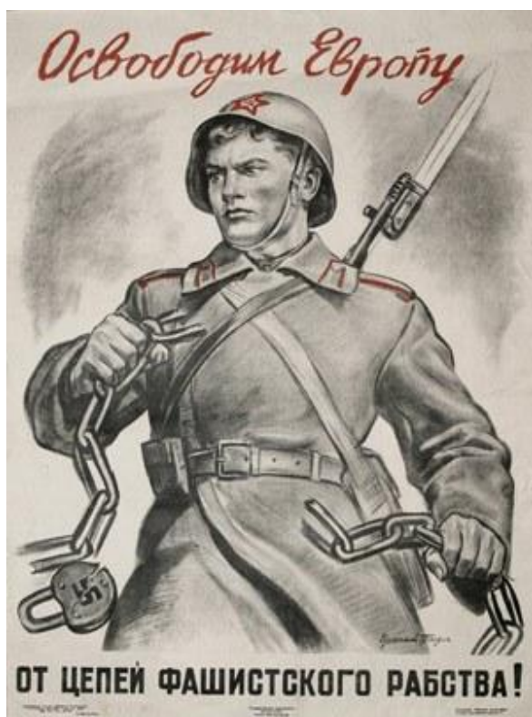
Ο Κόκκινος Στρατός σπάει τα δεσμά του φασισμού

Αντίθετη ακριβώς ήταν η εικόνα στη Γερμανία. Στις 3 Φεβρουαρίου του 1943 η Ανώτατη Διοίκηση Ενόπλων Δυνάμεων της χώρας εξέδωσε ένα ειδικό ανακοινωθέν στο οποίο αναφερόταν: « Η μάχη του Στάλινγκραντ ετελείωσε. Πιστοί στον όρκον των να πολεμήσουν μέχρι τελευταίας πνοής, οι άνδρες της Έκτης Στρατιάς, υπό την υποδειγματική ηγεσίαν του στρατάρχου Πάουλους, κατεβλήθησαν υπό της υπεροχής του εχθρού και υπό των δυσμενών συνθηκών που αντιμετωπίζουν αι δυνάμεις μας ». Πριν την ανάγνωση της ανακοίνωσης, από το γερμανικό ραδιόφωνο ακούστηκε τυμπανοκρουσία σε χαμηλό τόνο και μετά την ανάγνωση παίχτηκε το δεύτερο μέρος της Πέμπτης Συμφωνίας του Μπετόβεν. Στη συνέχεια γνωστοποιήθηκε πως με εντολή του Χίτλερ είχε κηρυχθεί τετραήμερο εθνικό πένθος στο διάστημα του οποίου όλα τα θέατρα, οι κινηματογράφοι και τα κέντρα διασκέδασης της χώρας θα παρέμεναν κλειστά 25 .