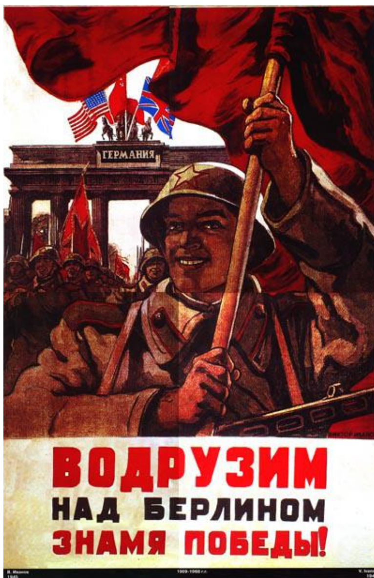
Ο νικηφόρος Κόκκινος Στρατός στο Βερολίνο

Η πραγματικότητα έχει τους δικούς της αδυσώπητους νόμους. Και η πραγματικότητα της νίκης στο Στάλινγκραντ, πρώτα στους ηττημένους και ύστερα σ' ολόκληρο τον κόσμο έδειξε με αδιαμφισβήτητο τρόπο ότι οι βεβαιότητες του εχθρού είχαν καταρρεύσει όλες, ότι η ροή του πολέμου είχε αλλάξει ριζικά.