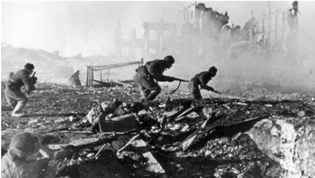
Εφόρμηση στα χαλάσματα του Στάλινγκραντ

Κρίνοντας εκ των υστέρων – και εκ του αποτελέσματος -, μπορεί εύκολα κανείς να προβεί σε χαρακτηρισμούς τόσο για τη στρατηγική του Χίτλερ όσο και για εκείνη που ακολούθησαν οι Σοβιετικοί. Γι' αυτό ας σταθούμε σε περισσότερο αντικειμενικά στοιχεία. Βλέποντας κανείς το συσχετισμό δυνάμεων εκείνης της εποχής ανάμεσα στη Σοβιετική Ένωση και τη Γερμανία δεν μπορεί παρά να αναγνωρίσει ότι το πλεονέκτημα ήταν με το μέρος των Γερμανών. Έχοντας υπό την κατοχή της ολόκληρη την ηπειρωτική Ευρώπη, η ναζιστική Γερμανία αξιοποιούσε για τις πολεμικές της ανάγκες τα εργοστάσια της Γαλλίας, του Βελγίου, της Αυστρίας, της Τσεχοσλοβακίας, κλπ., πράγμα που σήμαινε ότι υπερτερούσε ασύγκριτα έναντι της ΕΣΣΔ. Επιπλέον, οι πόροι της για τη βαριά βιομηχανία – τη δική της και των κατεχόμενων χωρών – ήταν δύο με δυόμισι φορές περισσότεροι από εκείνους της Σοβιετικής Ένωσης. Η Γερμανία είχε διπλάσιους εργάτες στην εθνική της οικονομία απ' ό,τι η ΕΣΣΔ, χώρια που στις κατακτημένες χώρες και χώρες – δορυφόρους της εκατομμύρια εργάτες δούλευαν για την πολεμική της μηχανή. Το 1942, μάλιστα, το 1/4 της γερμανικής πολεμικής παραγωγής το έδιναν οι κατακτημένες περιοχές.