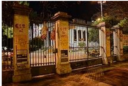
Η πύλη του Πολυτεχνείου, 17 Νοεμβρίου 2011