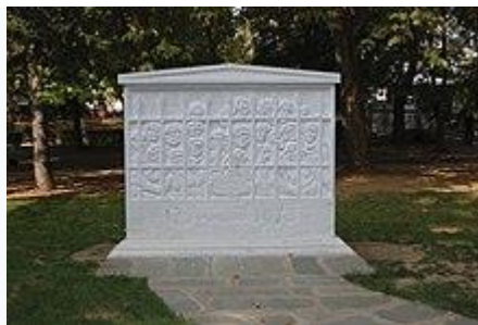
Το Μνημείο των πεσόντων Ηρώων του Πολυτεχνείου στον δημοτικό κήπο Δράμας

Η αιματηρή καταστολή της εξέγερσης, που –όπως προκύπτει από την επισκόπηση του καταλόγου των καταγεγραμμένων νεκρών– χαρακτηρίστηκε από δολοφονίες πολιτών ακόμη και δυο μέρες μετά τη στιγμή