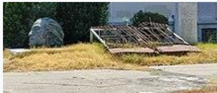
Η παλιά σιδερένια πύλη (2021)