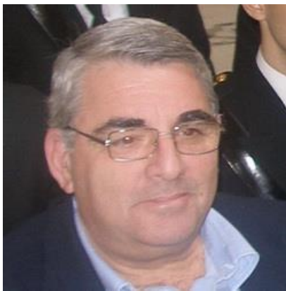
Αντιναύαρχος Κωτσής Φώτιος (βιογραφικό στο τέλος)