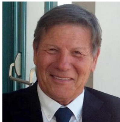
Υποναύαρχος Φακίρης Σπυρίδων