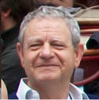
Αντιναύαρχος (Μ) Δημόπουλος Αντώνιος