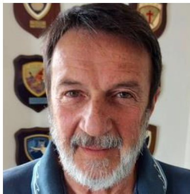
Αντιναύαρχος Τζαβάρας Μαργαρίτης