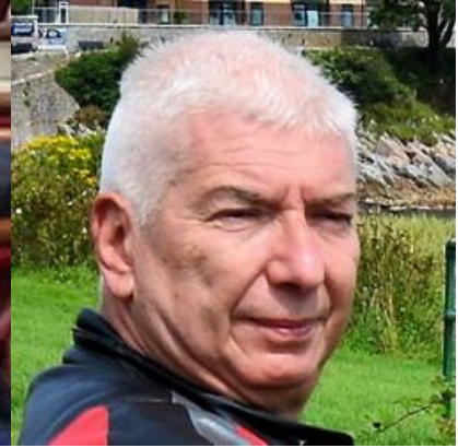
Υποναύαρχος (Μ) Καψοκαβάδης Σπυρίδων