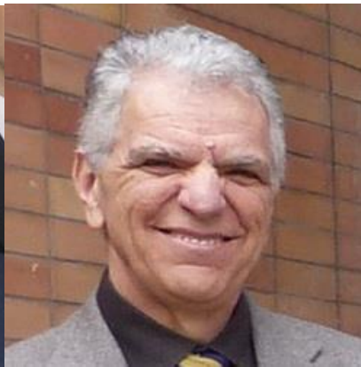
Αντιναύαρχος Ξενάκης Ανδρέας