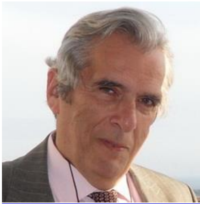
Υποναύαρχος (Μ) Αναστασάκης Αντώνιος