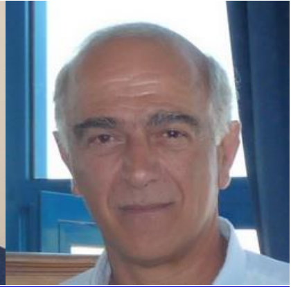
Αντιναύαρχος (Μ) Δημητρόπουλος Βασίλειος