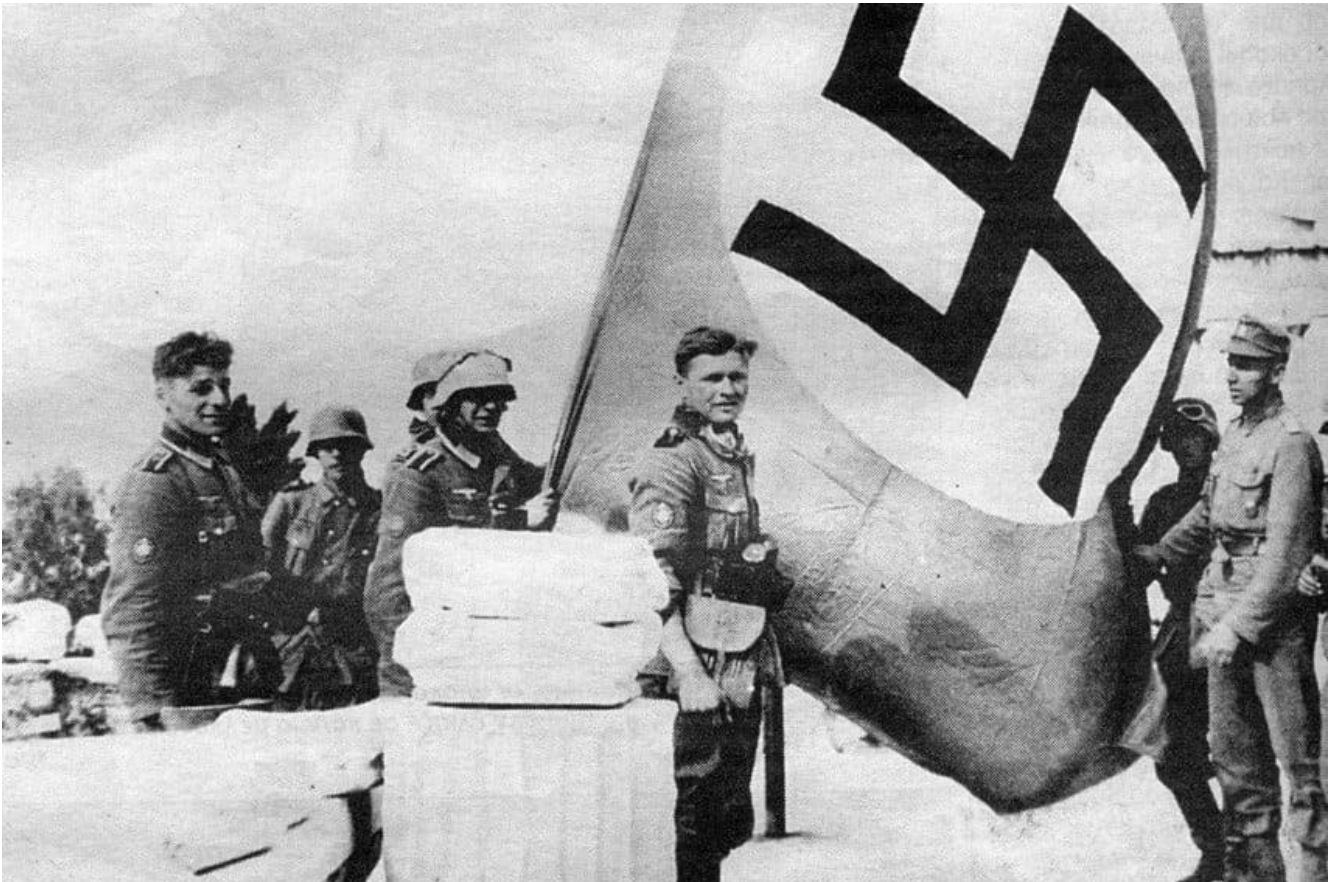
Γερμανοί στρατιώτες υψώνουν τη σβάστικα στην Ακρόπολη [Δημόσιος Τομέας]

Από τον Φίλιππο Χρυσόπουλο, 27 Απρ. 2025