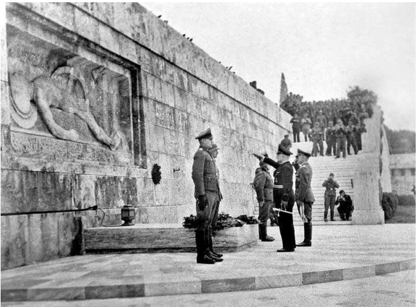
Γερμανικά στρατεύματα στο Μνημείο Αγνώστου Στρατιώτη, στην Αθήνα [Δημόσιος Τομέας]